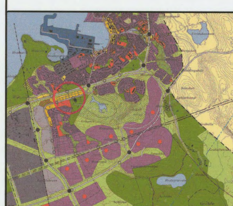
Aðalskipulag Hafnarfjarðar 2005-2025