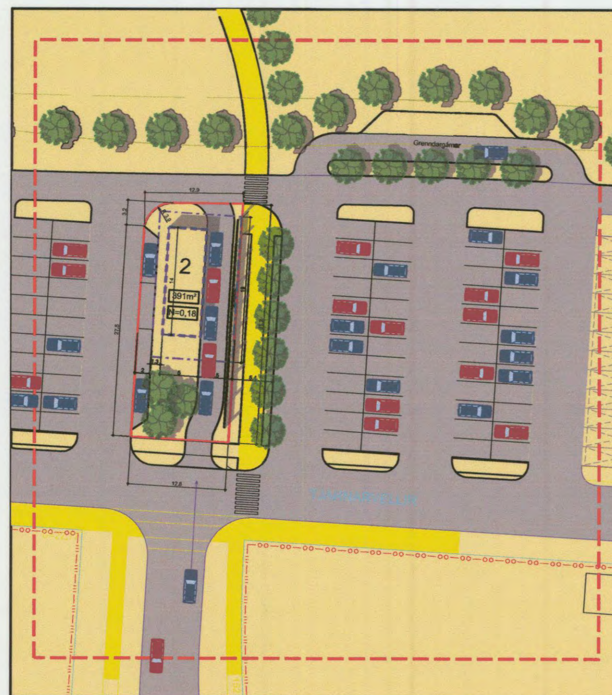
TILLAGA AÐ BREYTINGU