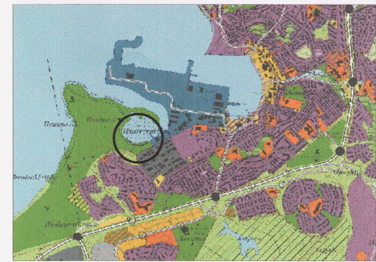
STADSETNING Í BÆJARLANDINU