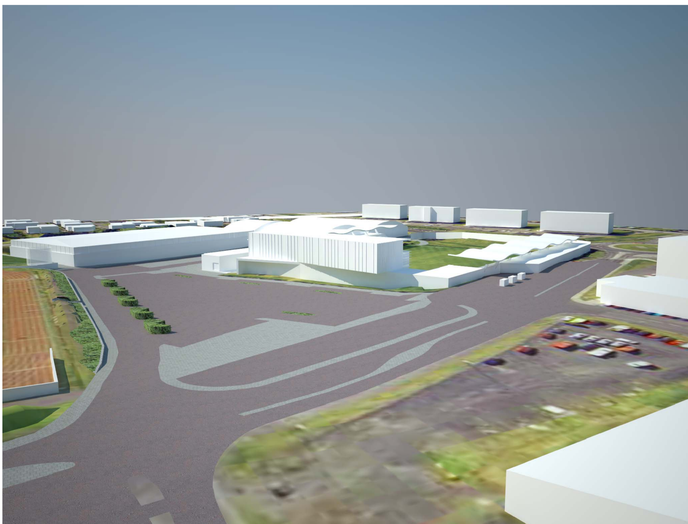
SVÆÐIÐ SÉÐ FRÁ AUSTRI