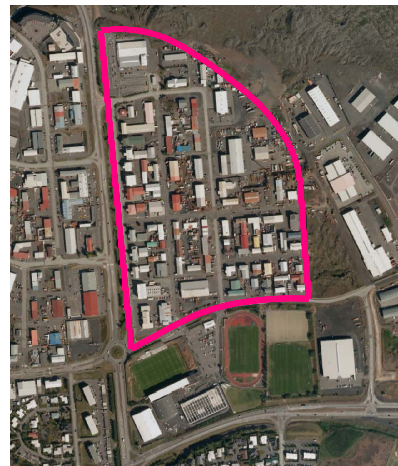
SVÆÐI ÞAR SEM HÆGT ER AÐ SAMNÝTA BÍLASTÆÐI