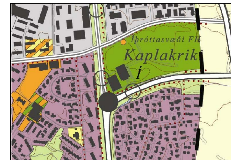
ADALSKIPULAG HAFNARFJARÐAR 2005-2025