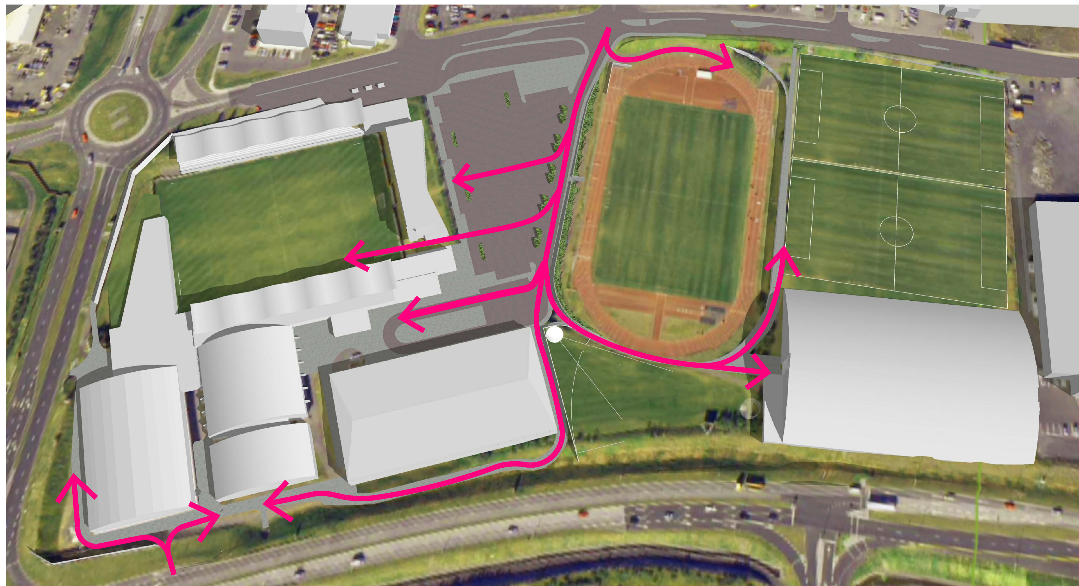
AÐKOMULEIÐIR SJÚKRABÍLA OG SLÖKKVILIÐS