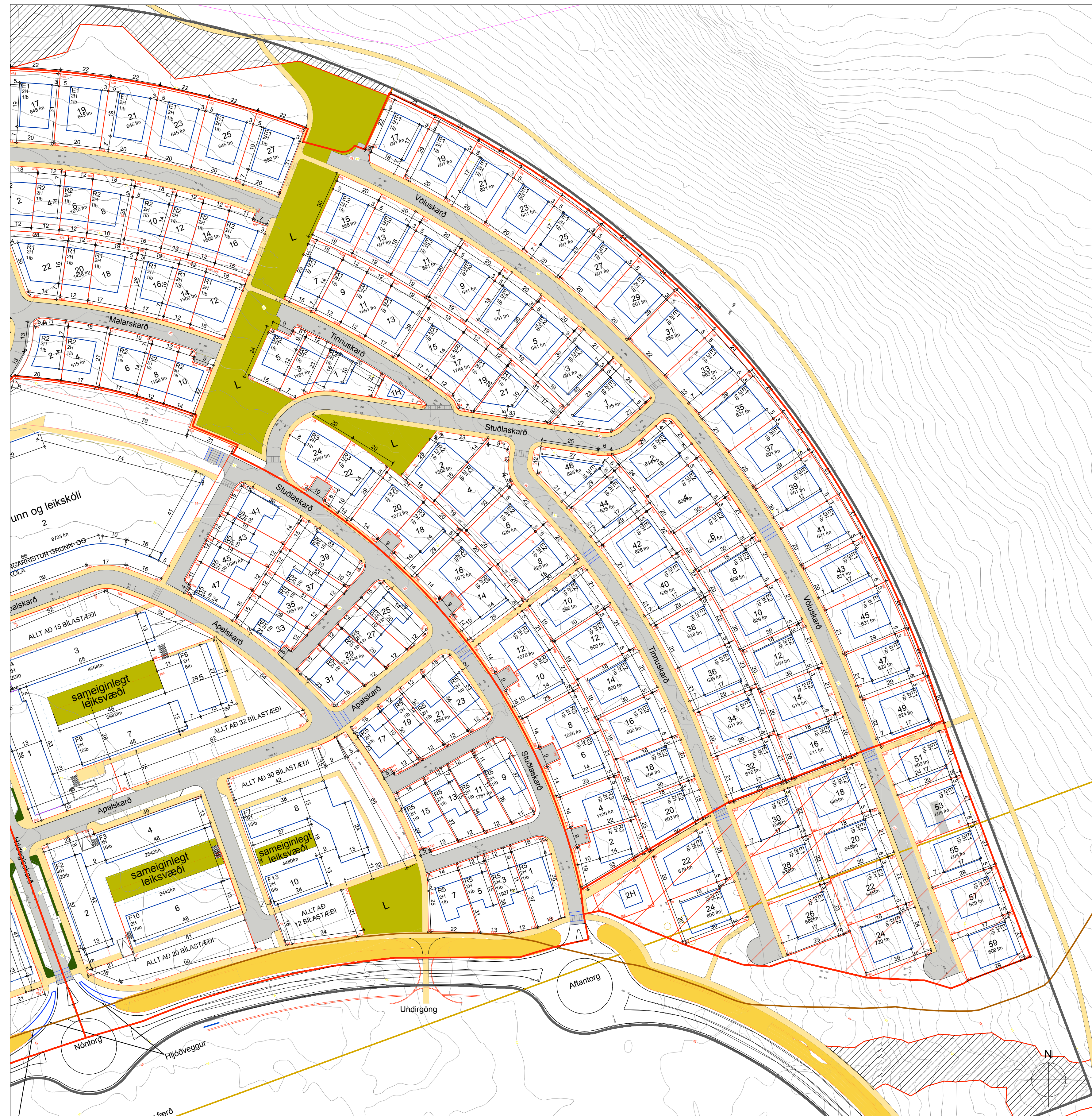
GILDANDI DEILISKIPLAG SKARÐSHLÍÐAR, HLU TAMYND. MKV. 1:1000. DAGS: 08.05.2013