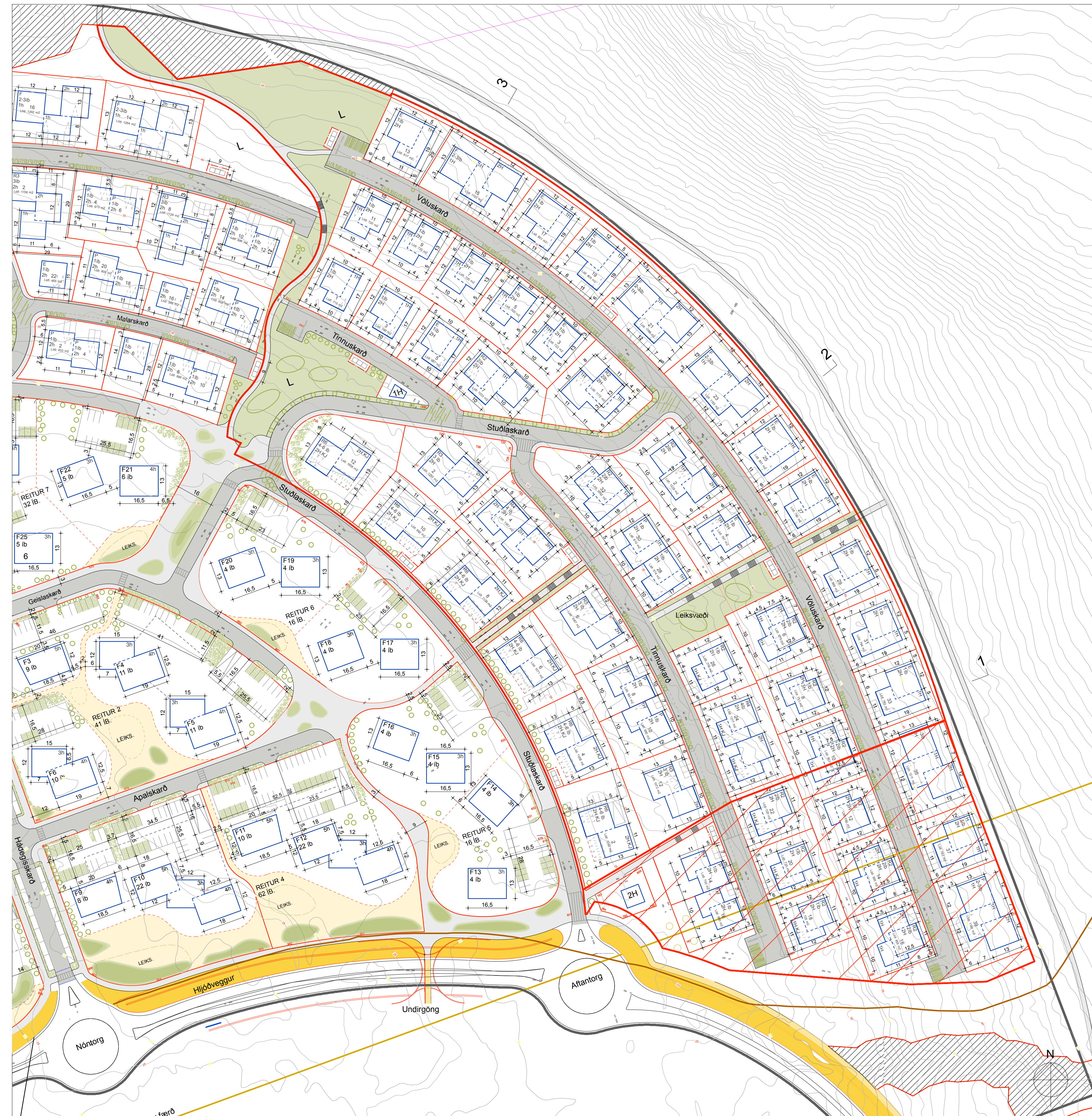
BREYTT DEILISKIPLAG SKARÐSHLÍÐAR, 3. ÁFANGI. MKV. 1:1000