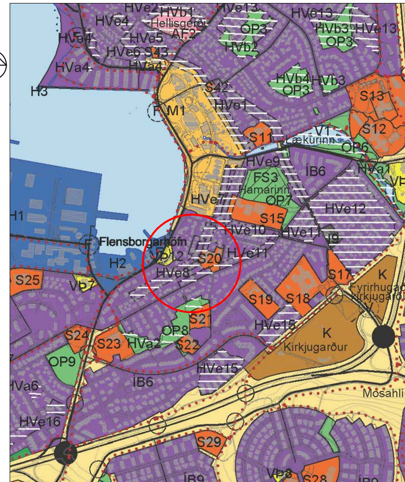
Breytt landnotkun — Mörk breytinga 1:15.000