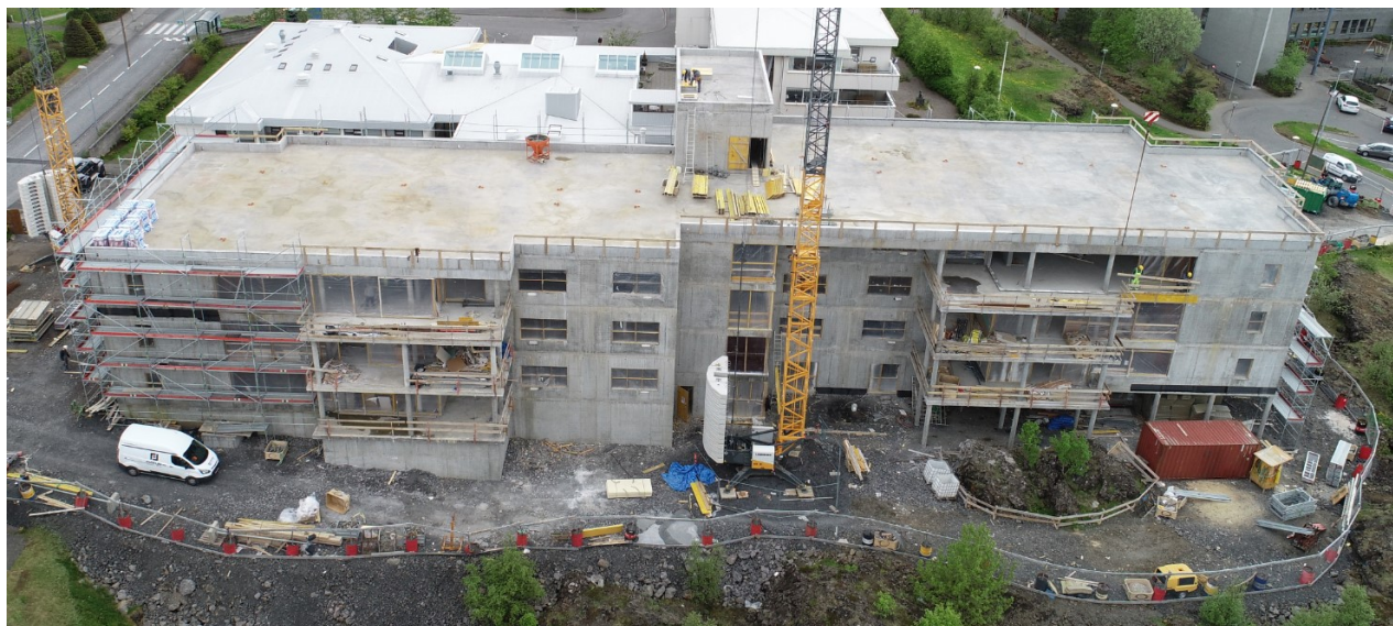
Vettvangsmynd á fundardag. ( Bygging uppsteypt að frátöldum tengigangi og 6stk súlum 3.hæðar ).

Nr. FUNDARGERÐ: Frestur: Ábm.: Skáletraður texti er óbreytt bókun frá síðasta fundi.