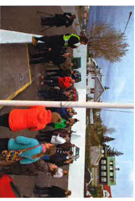
Frá skipulagðri göngu um svæðið í júní 2015