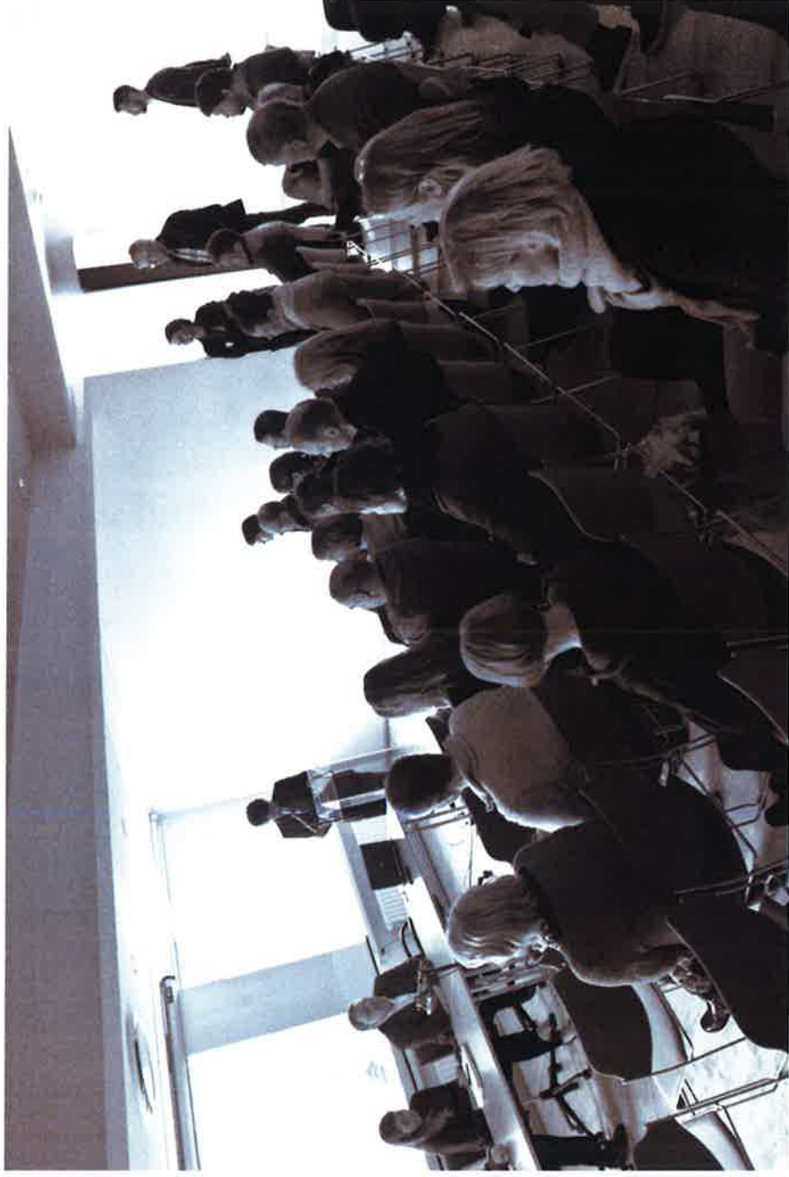
Umræða skapaðist og góðar athugasemdir bárust einnig úr sal