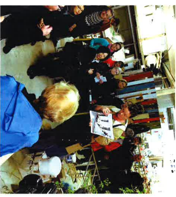
Frá heimsoákn í Íshús Hafnarfarðar í júní 2015