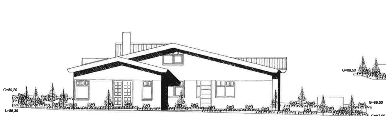
ÚTLIT NORÐVESTUR MKV 1:100