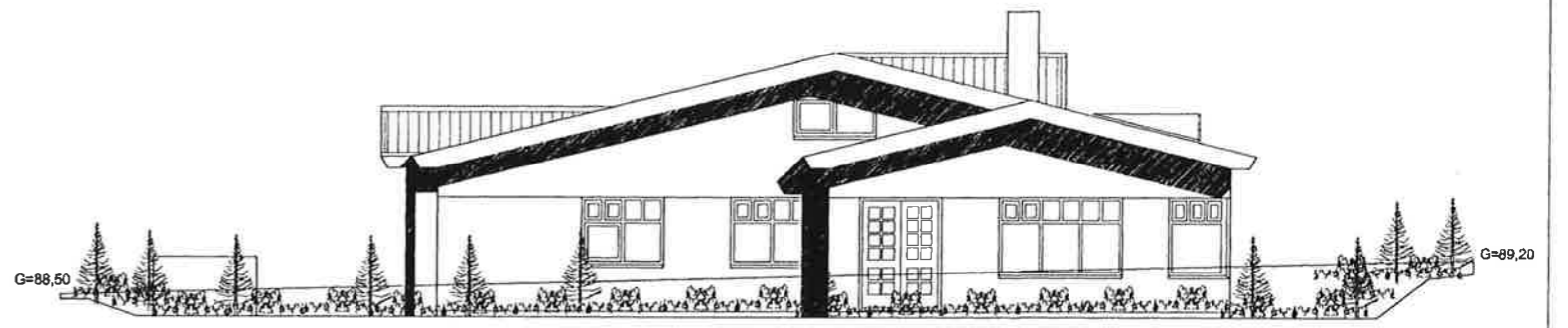
ÚTLIT SÚÐAUSTUR MKV 1:100