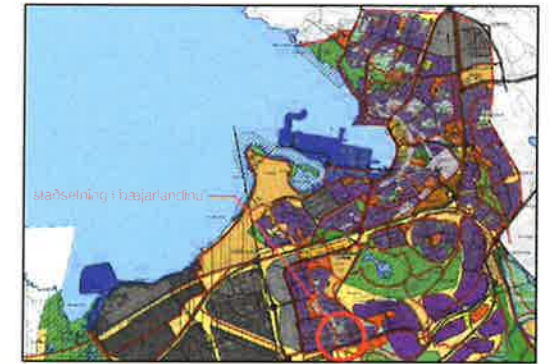
ADALSKIPULAG HAFNARFJARÐAR 2013-2025