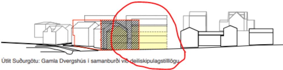
Útlit Suðurgötu: Gamla Dvergshús í samanburði við deiliskipulagstillögu

Gerð er athugasemd við byggingu húss 2a sem sett er niður, á því sem næst auðan reit miðað við fyrra skipulag, og mun blokka útsýni til vesturs fyrir íbúa Brekkugötu og Lækjargötu og jafnframt eyðileggja útsýn vegfarenda um Suðurgötu, Lækjargötu, Strandgötu og Fjarðargötu, uppá eina helstu heillegu götumynd húsa á Íslandi sem eru yfir 100 ára gömul.