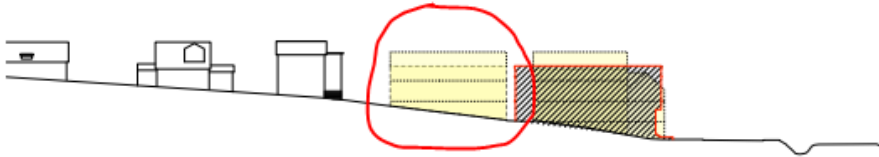
Útlit Brekkugötu: Gamla Dvergshús í samanburði við deiliskipulagstillögu

Gerð er athugasemd á lokun útsýnis með byggingu 2e sem sett er niður á auðan reit og mun blokka útsýni til vesturs fyrir íbúa Brekkugötu og Lækjargötu og jafnframt eyðileggja útsýn vegfarenda um Suðurgötu, Lækjargötu, Strandgötu og Fjarðargötu, uppá Hamarinn og eina helstu heillegu götumynd húsa á Íslandi sem eru yfir 100 ára gömul.