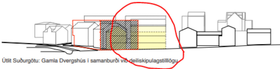
Útlit Suðurgötu: Gamla Dvergshús í samanburði við deiliskipulagstillögu

Gerð er athugasemd við byggingu húss 2a sem sett er niður, á því sem næst auðan reit miðað við fyrra skipulag, og mun blokka útsýni til vesturs fyrir íbúa Brekkugötu og Lækjargötu og jafnframt eyðileggja útsýn vegfarenda um Suðurgötu, Lækjargötu, Strandgötu og Fjarðargötu, uppá eina helstu heillegu götumynd húsa á Íslandi sem eru yfir 100 ára gömul.