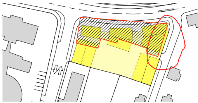
Afstaða: Gamla Dvergshús í samanburði við deiliskipulagstillögu

Gerð er athugasemd við færslu bygginga í austur og þar með þrengt að gangstétt og húsin færð alltof nálægt húsunum sem standa í Brekkugötunni.