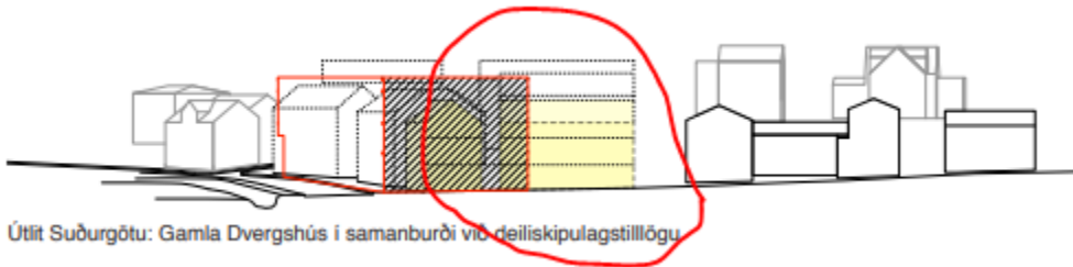
Útlit Suðurgötu: Gamla Dvergshús í samanburði við deiliskipulagstillögu

Gerð er athugasemd við byggingu húss 2a sem sett er niður, á því sem næst auðan reit miðað við fyrra skipulag, og mun blokka útsýni til vesturs fyrir íbúa Brekkugötu og Lækjargötu og jafnframt eyðileggja útsýn vegfarenda um Suðurgötu, Lækjargötu, Strandgötu og Fjarðargötu, uppá eina helstu heillegu götumynd húsa á Íslandi sem eru yfir 100 ára gömul.