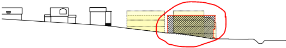
Útlit Brekkugötu: Gamla Dvergshús í samanburði við deiliskipulagstillögu

Gerð er athugasemd við hækkun sjónlínu á mæni bygginganna eins og sjá má af teikningunni hér að ofan.