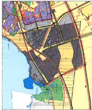
Aksturs- og skotæfingarsvæði 2013-2025 (hluti)

Að öðru leyri gæta skilmála í gildandi deiliskipulagi sem samþykkt var í bæjarstjórn Hámarfjarðar 2.5.2008 með síðari breytingum.