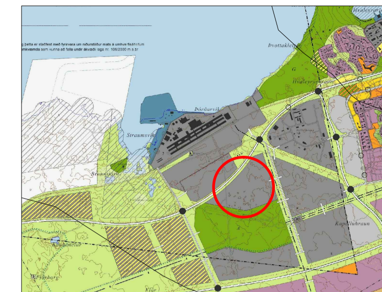
ADALSKIPULAG HAFNARFJARÐAR 2005 - 2025

S:\AUTOCAD\deiliskipulag\12-kapelluhraun\mjast_130109\deiliskibr_140224[Bronshella].dwg