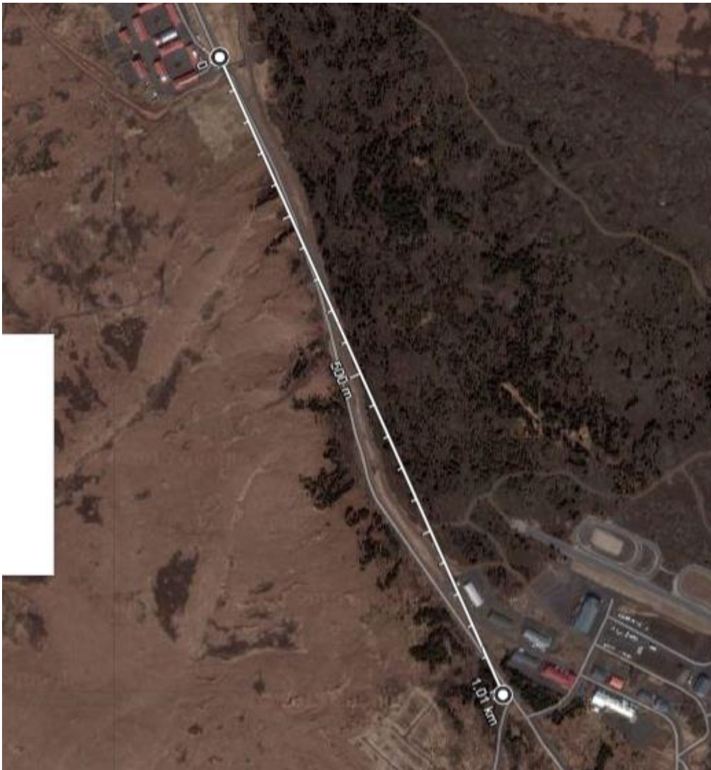
Mynd 4; Loftmynd, Kaldárselsvegur frá Hlíðarþúfum að Sörlasvæði / Hvaleyrarvatnsvegi