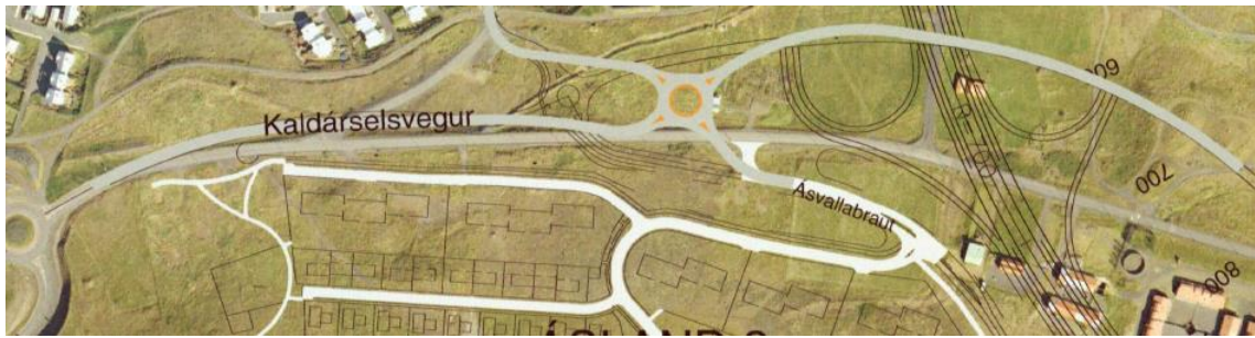
Mynd 3; Ný lega Kaldárselsvegur frá frá hringtorgi við Reykjanesbraut og inn á núverandi legu Kaldárselsvegur sunnan við Hlíðarþúfur. Tengingar við Kletthlíð og Ásvallabraut með hringtorgi.