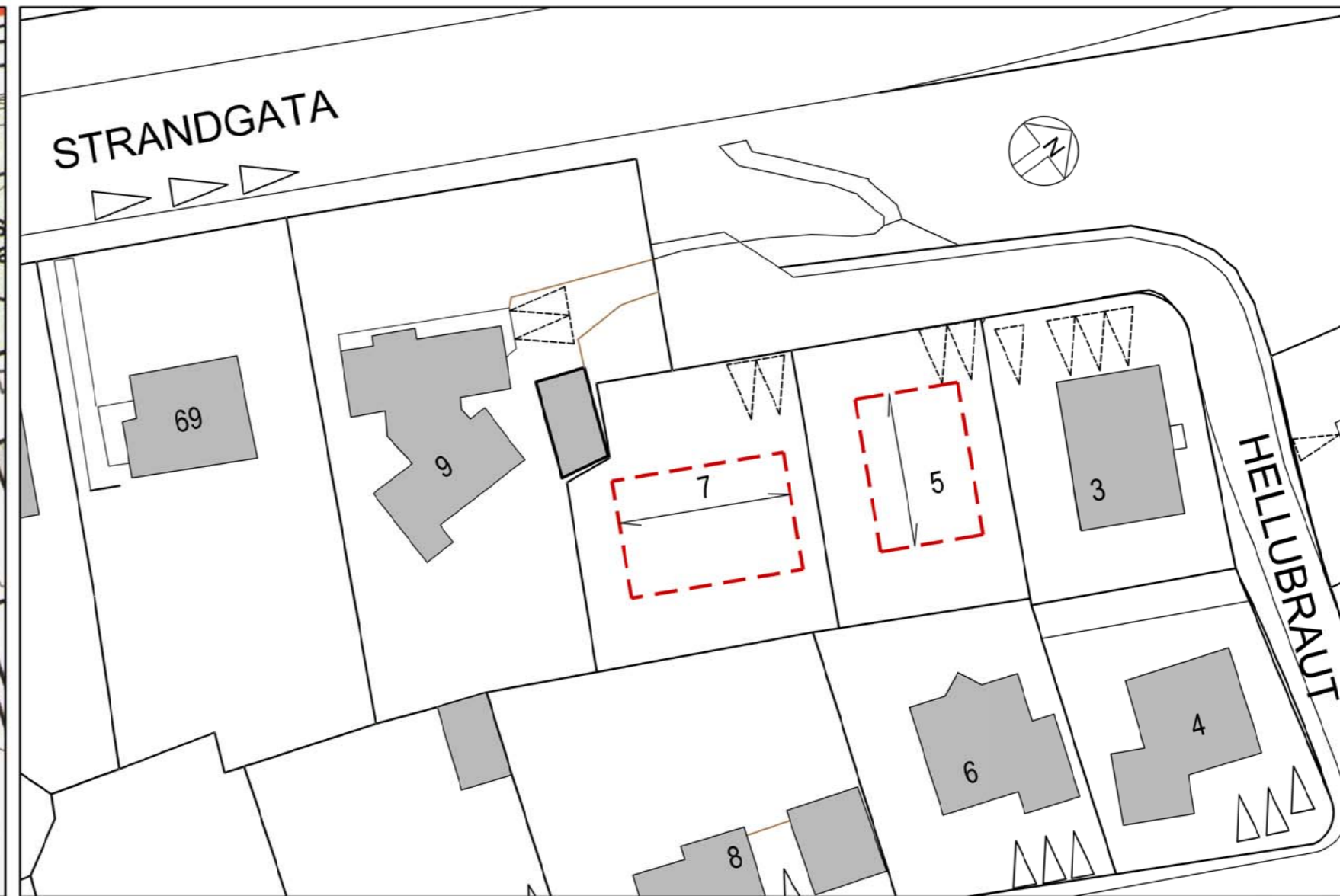
TILLAGA AÐ BREYTTU DEILISKIPULAGI M 1:500