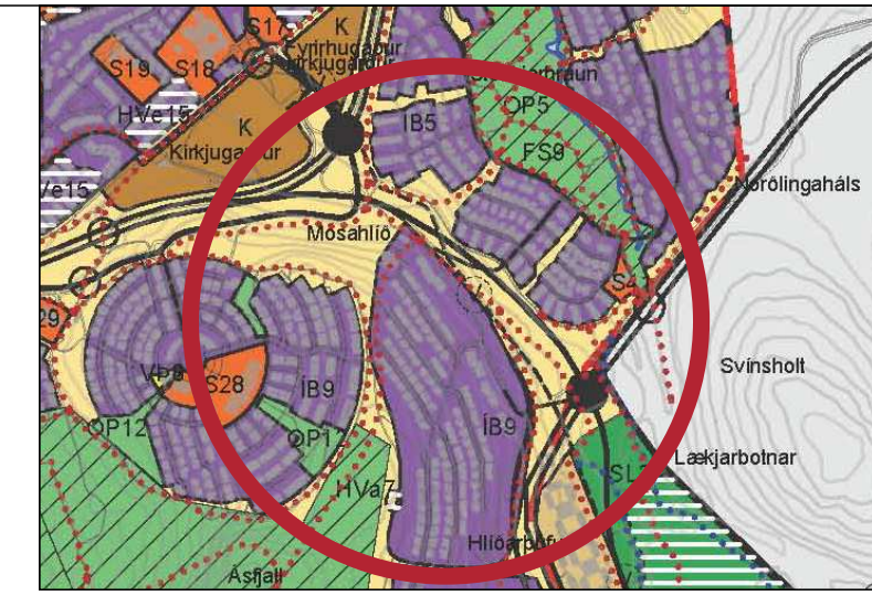
Hluti úr Aðalskipulagi Hafnarfjarðar 2013-2025.