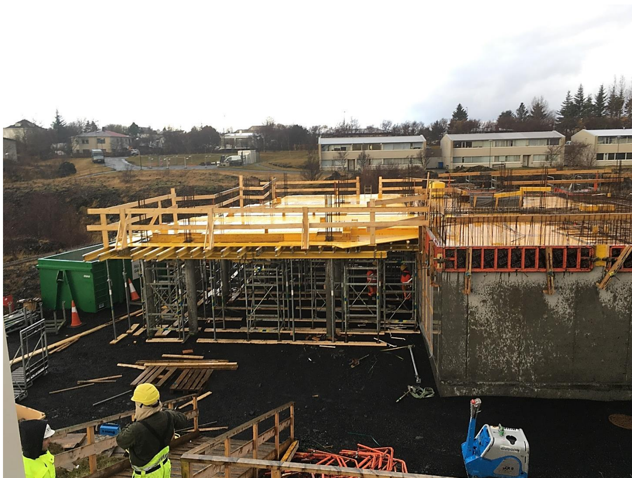
Vettvangsmynd fundardag. (Unnið við undirslátt og járnbandingu plötu yfir kjallara, vesturenda.)