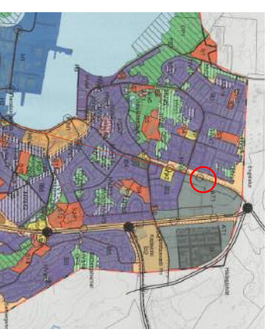
Staðsetning skipulagssvæðis í bænum.