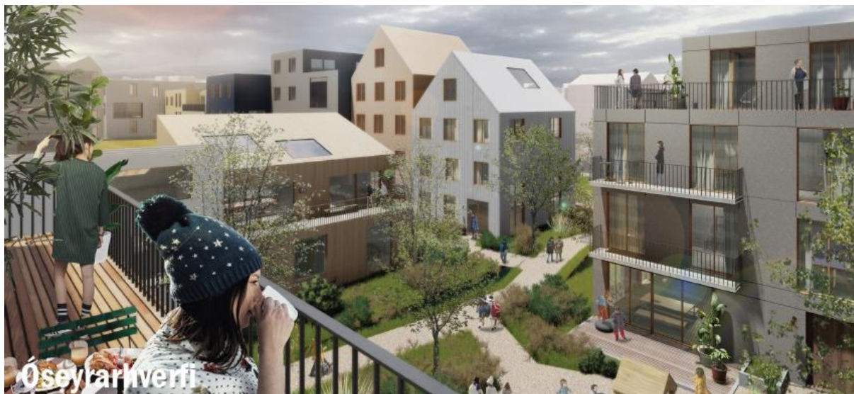
Óseyrarhverfi Úr rammaskipulagi Flensborgarhafnar- og Óseyrarsvæðis

Í Óseyrarhverfi víki lágreistar skemmur fyrir vistvænni íbúðabyggð. Byggingar verði að jafnaði 3 – 5 hæðir, með heimild fyrir inndregna 6. hæð á völdum stöðum. Gert er ráð fyrir verslun og þjónustu á jarðhæð íbúðarhúsa í hluta hverfisins. Nánari útfærslur verði unnar á deiliskipulagsstigi.