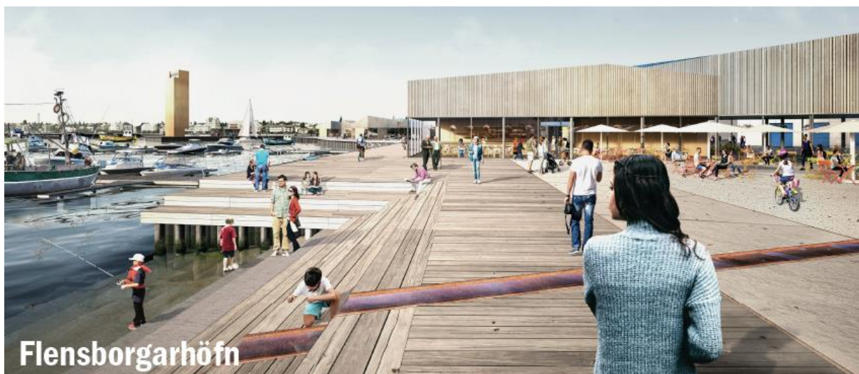
Úr rammaskipulagi Flensborgarhafnar- og Óseyrarsvæðis

Við Flensborgarhöfn rísi lágreist byggð fyrir blandaða starfsemi, afþreyingu, smávöruverslun og nýsköpun, sem og íbúðir á efri hæðum. Hámarkshæð húsbygginga verði allt að 3 hæðir með tveimur undantekningum um fjórðu hæð og kennileiti. Byggð verði smágerð og áhersla lögð á skjólgóð dvalarsvæði og göngu- og hjólastíga.