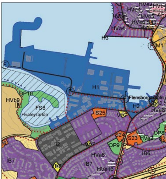
Aðalskipulag Hafnarfjarðar 2013-2025

Fyrirhuguð breyting verður sett fram á breytingarblaði þar sem gerð verður gein fyrir breyttri landnotkun á aðalskipulagsupphætti og þeim breytingum sem gera þarf á greinargerð, almennum texta og sérskilmálum svæðisins.