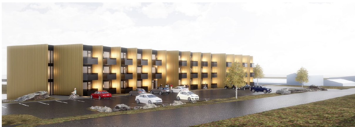
Tillaga að hótélbyggingu Hvaleyrarbraut 30

Í aðalskipulagi Hafnarfjarðar 2013-2025 er gert ráð fyrir að á hafnarsvæði geti verið viss þjónustustarfsemi, sem tengist hverfinu á einhvern hátt. Með verslun og þjónustu í huga hlaut breyting á landnotkunarflokki á reit sem afmarkast af Hvaleyrarbraut og Lónsbraut, frá Stapagötu að vestur mörkum Suðurhafnar, Hvaleyrarbraut 20 – 32, jákvæðar undirtektir hjá skipulags- og byggingarráði þann 31.10.2017 og í hafnarstjórn þann 10.11.2017 og var samþykkt heimild til aðalskipulagsbreytingar á svæðinu með áherslu á að þar verði áfram hafnsækin starfsemi í forgrunni.