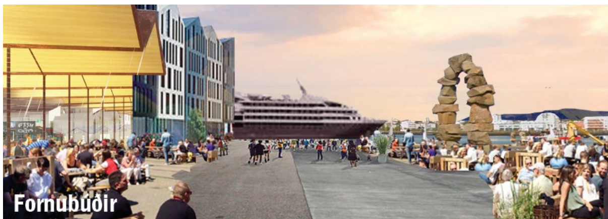
Fornubúðir Úr rammaskipulagi Flensborgarhafnar- og Óseyrarsvæðis

Við Fornubúðir rísi allt að 4 – 6 hæða byggð sem hýsir blandaða starfsemi. Við Suðurbakka leggist farþegaskip áfram að bryggju.