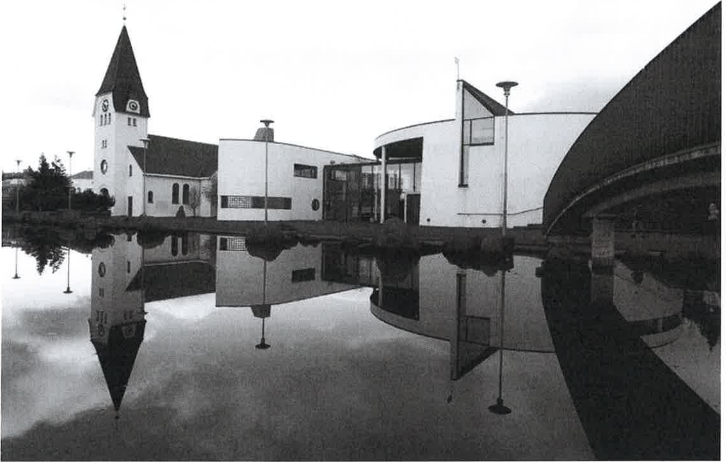
Hafnarfjörður Hafnarfjarðarkirkja kirkja