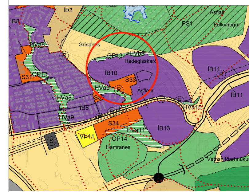
HLUTI AÐALSKIPULAGS HAFNARJARÐAR 2013-2025 STAÐSETNING SVÆÐISINS

Byggingarreitur og byggingarflata er sú sama og er táknuð með heilli línu. Byggingarreitur sýnir hámarksgrunnflöt byggingar. Öheimilt er að fara út fyrir byggingarreit.