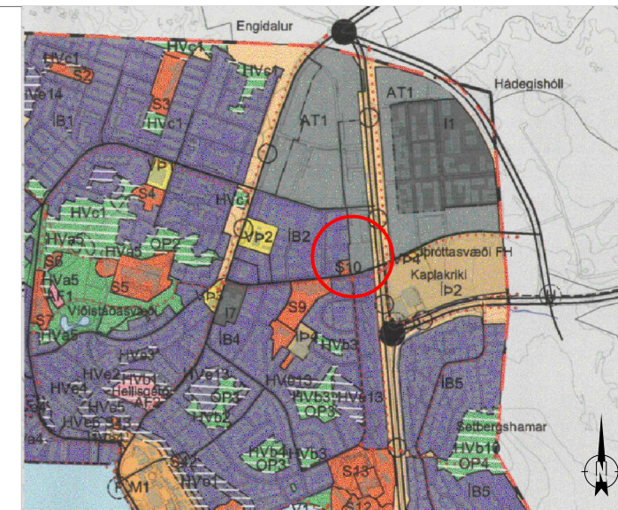
HLUTI AÐALSKIPULAGS HAFNARFJARÐAR 2013 - 2025