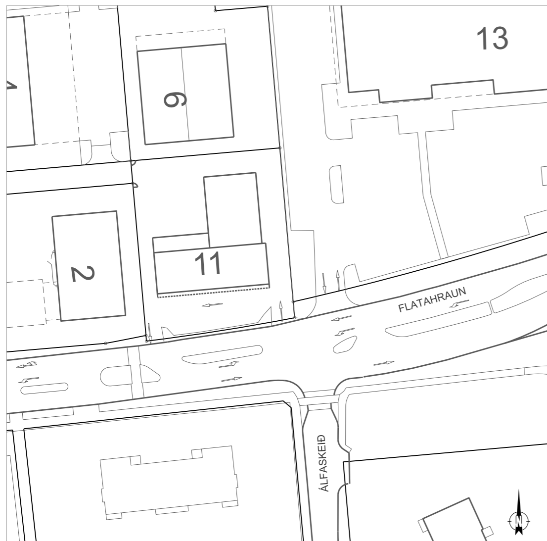
FYRIR BREYTINGU - Í GILDI FRÁ 25.02.2015, MKV: 1:1000