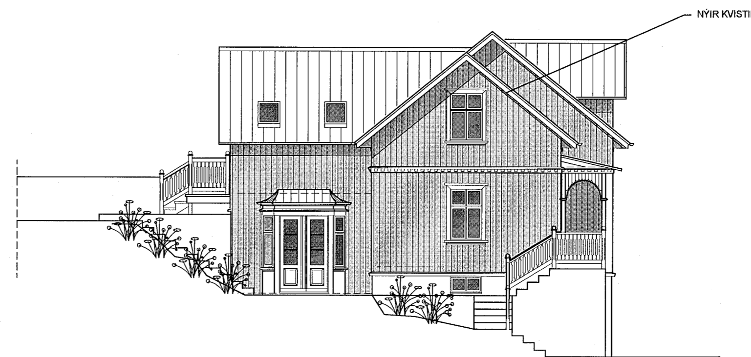
ÚTLIT NORÐAUSTURHLIÐ 1:100

Byggingarlýsing fyrir einbýlishús að Hverfisgötu 23, Hafnarfirði. Staðgreinir : 1400-1-44900230. Upprunalegur hönnuður ókunnur. Byggingarár 1920.