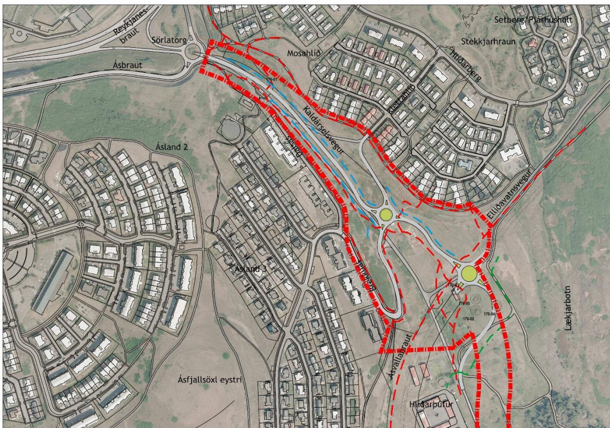
Mynd 1. Yfirlitsmynd – Afmörkun deiliskipulagssvæðis. (Teiknistofan Storð ehf, 2017).

Deiliskipulagið nær til svæðis sem liggur á milli nokkurra deiliskipulagsáætlana og er ætlað að tengja saman þá vegi sem liggja að deiliskipulagssvæðinu og auka umferðaröryggi á svæðinu. Einnig er ætlunin að auka öryggi gangandi og hjólandi á svæðinu, en Kaldárselsvegur er lykiltenging fyrir íbúa og þá sem nýta sér uppland Hafnarfjarðar til fjölbreyttrar útivistar. Ný lega Ásvallabrautar liggur fyrir og er lega hennar á milli Hlíðarþúfa og íbúabyggðarinnar í Áslandi.