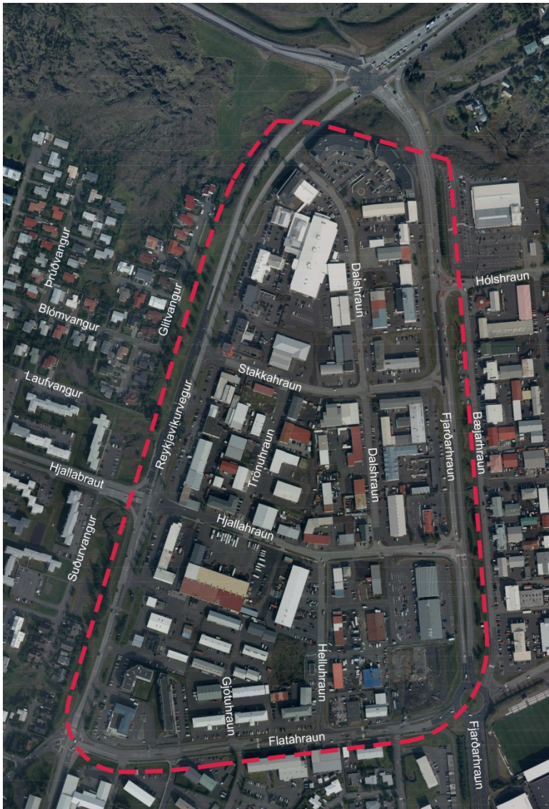
Afmörkun svæðis – loftmynd 2015

svæðisins. Byggingarland er nokkurn veginn flatt og lítið um gróður. Innan svæðisins liggja göturnar Dalshraun, Trönuhraun, Stakkahraun, Hjóllahraun, Helluhraun og Gjótuhraun.