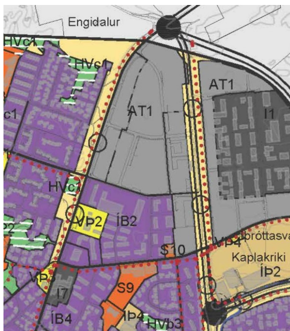
Aðalskipulag í gildi.