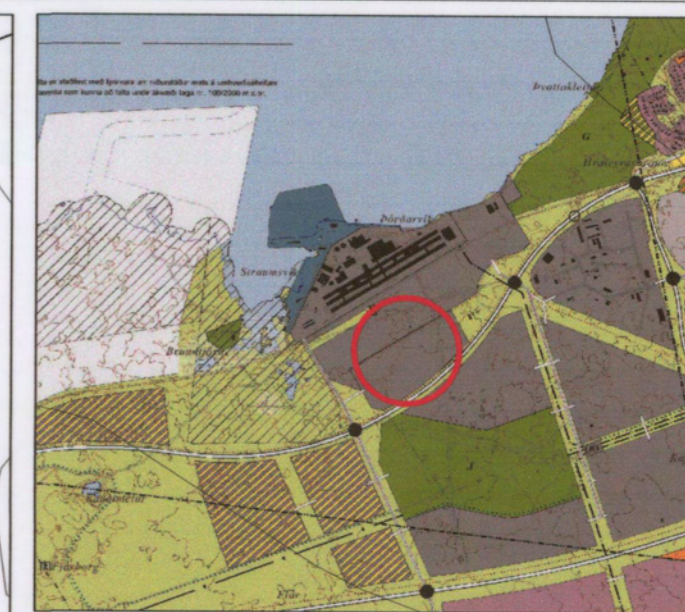
ADALSKIPULAG HAFNARFJARÐAR 2005 - 2025

DEILISKIPULAG ÞETTA, SEM FENGID HEFUR MEDFERÐ SKV. 1.M.GR.26.GR SKIPULAGS- OG BYGGINGARLAGA NR.73/1997 VAR SAMÞYKKT Í SKIPULAGS- OG BYGGINGARÁÐI HAFNARFJARÐAR