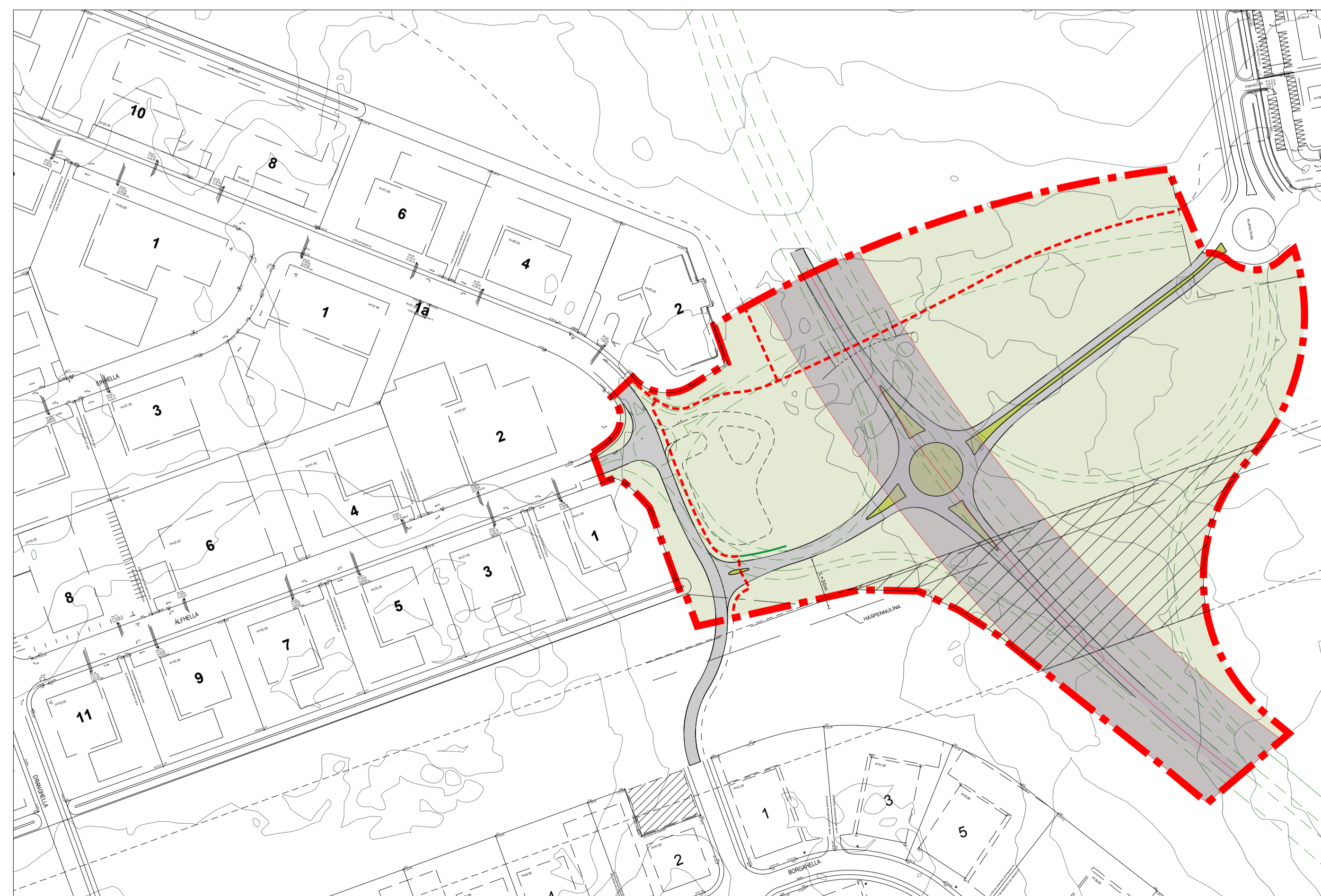
Deiliskipulagsbreyting - TILLAGA