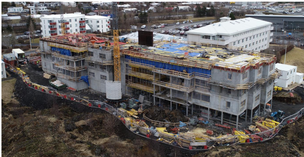
Vettvangsmynd á fundardag. (Yfirlitsmynd af nýbyggingu. Búið er að steypa plötu yfir 3.hæð að fullu og farið að huga að uppslætti veggja 4.hæðar.)

Nr. FUNDARGERÐ: Frestur: Ábm.: Skáletraður texti er óbreytt bókun frá síðasta fundi.