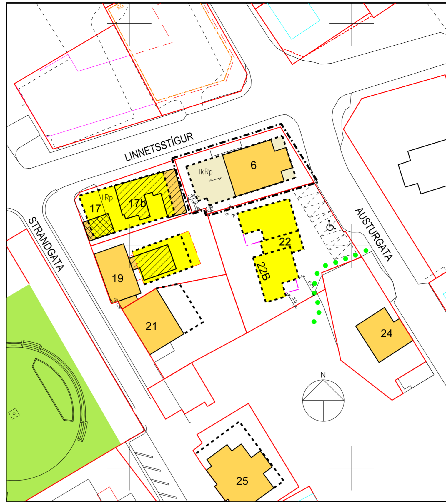
Skipulagsbreyting í sept. 2017, 1:500