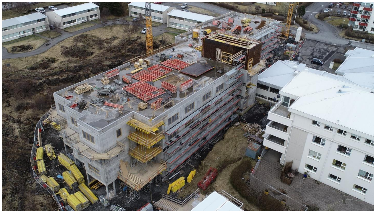
Vettvangsmynd 19-04-2018. ( Langt er komið að steypa portveggi þakplötu, unnið að uppslætti veggja 4.hæðar