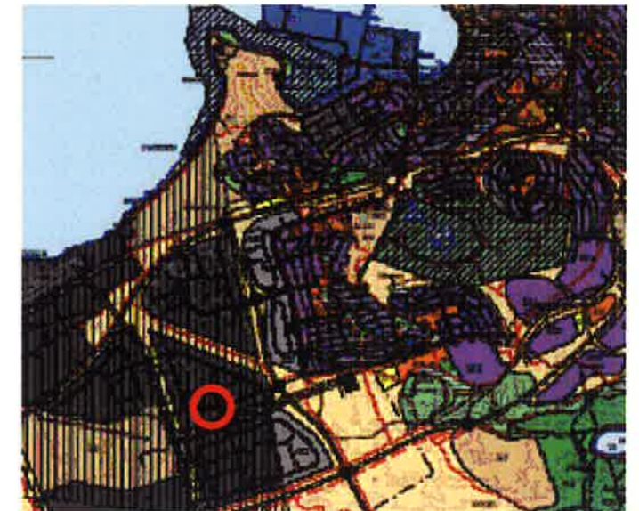
Hluti af aðalskipulagi Hafnarfjarðar. (2013-2025). SKÝRINGAR

Að öðru leiti gilda skipulagsskilmálar fyrir Hellnabraun 2. áfangi.