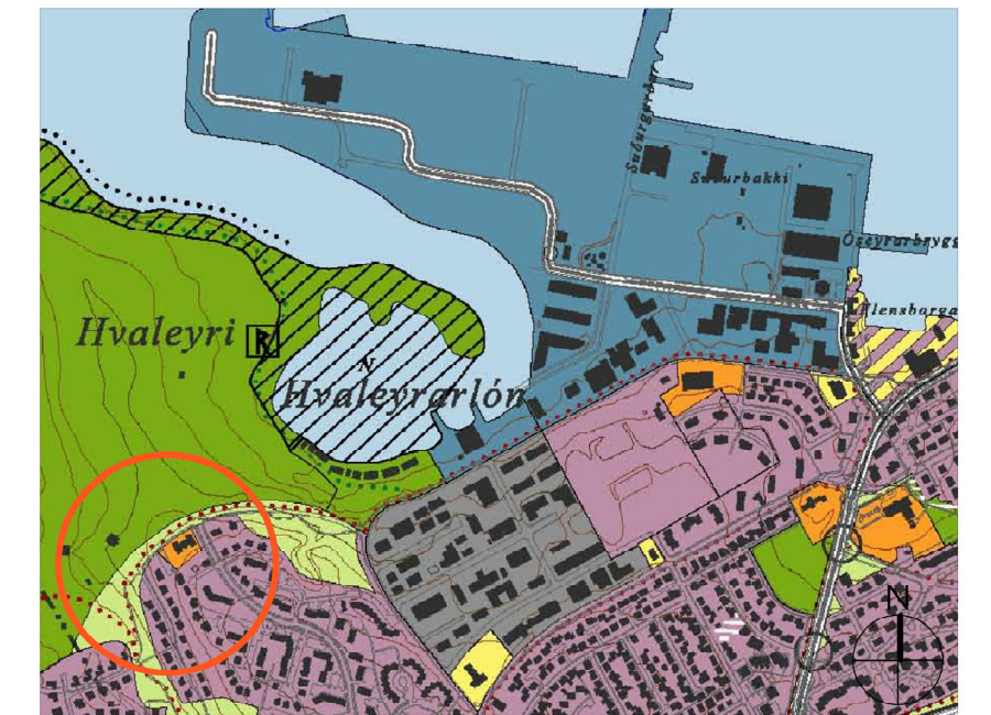
Aðalskipulag Hafnarfjarðar 2005-2025 - Staðsetning í bæjarlandi.

Að öðru leyti gilda deiliskipulag og skilmálar samþykkt í Skipulags- og byggingarráði Hafnarfjarðar þann 8. okt 2002 og Bæjarstjórn Hafnarfjarðar þann 15. okt 2002.