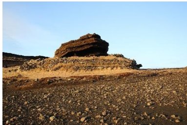
Séð yfir Strákafjánhús til norðurs.