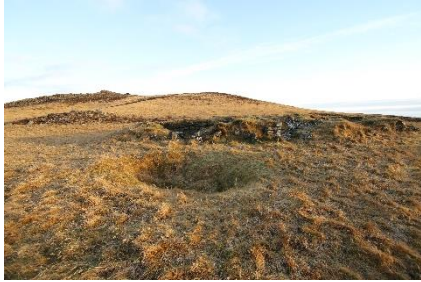
Séð yfir dældina/safngryfjuna við Fitjar.

Gamalt nr: 217-1 og GK-001:018 Hlutverk: Óþekkt Tegund: Niðurgroftur/Hleðsla Sérheiti: Aldur: 1550-1900 Hnit: 374778,914 346772,981 Staðarhættir: Á grasi gróinni grund í túni. Vestan við Selöldu rétt vestan við malarveg sem liggur frá Grindavíkurvegi að Krýsuvíkurborgi og austan við Fitjalæk/Vestarilæk. Lýsing: Skammt vestan við nyrsta dyraopið á Fitjatóftum er dæld í landslaginu, mjög sennilega safngryfjan sem nefnd er í örnefnalýsingu. Í örnefnalýsingu Ara Gíslasonar segir: „Fitjatún hefur fyrr verið nefnt, vestur við lækinn, vestur af Selöldu. Þar eru stæðilegar bæjartóttir, mikið túnstæði, og þar voru leifar eftir safngryfju, sem er óvanalegt á þeim árum“ 13 Dældin er um 1,5 x 3 m og í henni sést í hleðslur. Minjagildi: Talsvert Hætta: Hætta Hættuorsök: Vegagerð/Landeyðing Ástand: Vel greinanlegar fornleifar