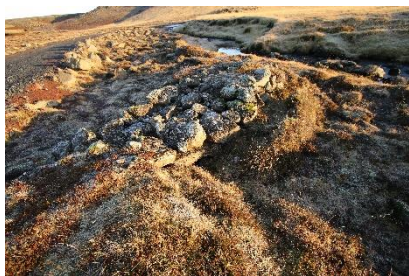
Séð yfir brúinna til austurs.