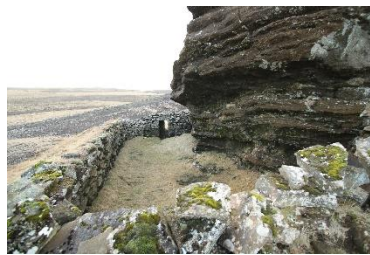
Séð inn í Strákafjánhús til suðvesturs.