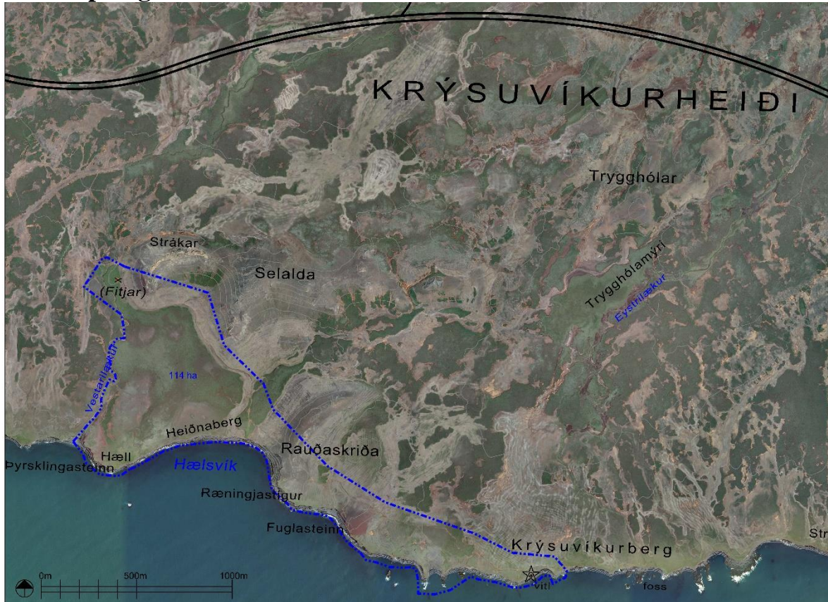
Yfirlitskort yfir hið deiliskipulagða svæði við Krýsuvíkurborg.