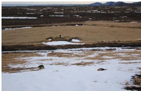
Séð yfir tóftirnar á Fitjarbænum, mynd tekin til vesturs.