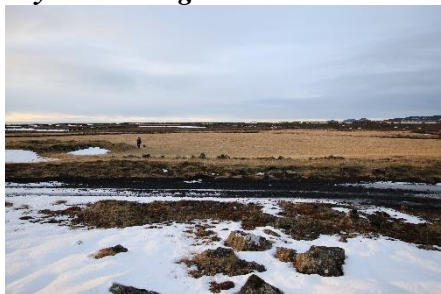
Séð yfir Fitjar og túngarðinn til vesturs.