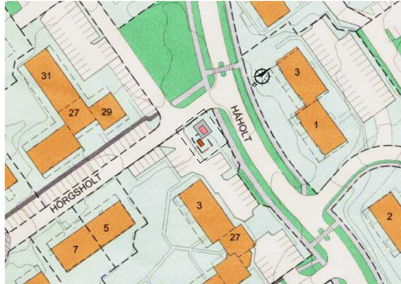
Tillaga að breytingu: Fyrirhuguð færsla á lóð og byggingarreit, Hörgsholt 1a í mkv. 1:1000