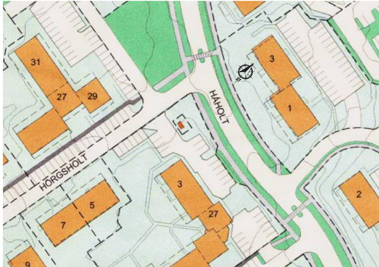
Yfirlitsmynd: Gildandi deiliskipulag fyrir Hvaleyrarholt, dags. 15.10.2002 í mkv. 1:1000