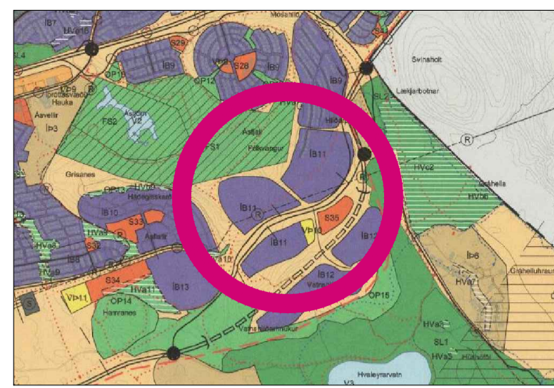
HLUTI AÐALSKIPULAGS HAFNARFJÖRÐAR 2013-2025