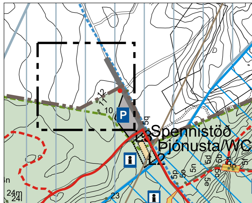
Hluti gildandi deiliskipulags sem tók gildi 29.01.2018