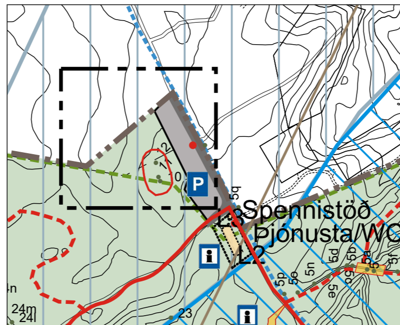
Deiliskipulagsbreyting - tillaga