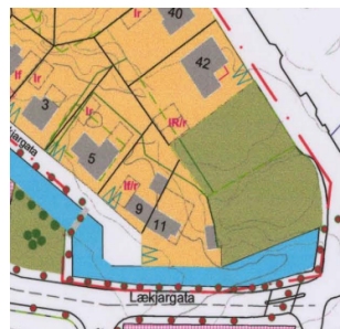
Deiliskipulag sem er í gildi