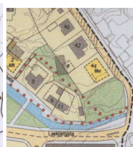
Deiliskipulag fyrir 2005