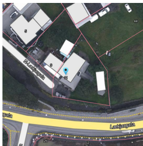
Kortavefur sýnir lóðamörk

Ekki er mælt með lóðarstækkun á Lækjargötu 11.