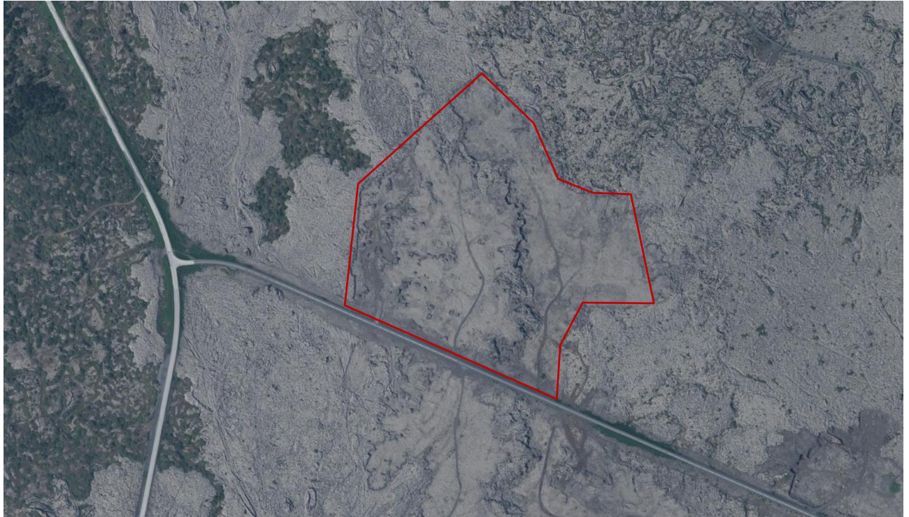
Mynd 2. Lofmynd af skipulagssvæðinu frá árinu 2019, rauð lína sýnir afmörkun skipulagssvæðisins.