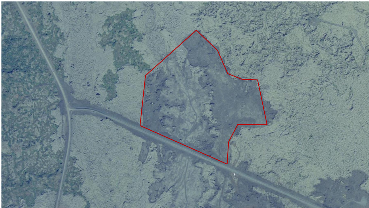
Mynd 1. Lofmynd af skipulagssvæðinu frá árinu 1999, rauð lína sýnir afmörkun skipulagssvæðisins.

Deiliskipulagssvæðið er 15 ha að stærð og nær yfir gömlu hraunnámuna við Snókalönd sem staðsett er norðan Bláfjallavegar og austan Krýsuvíkurveggar. Nokkur mosagróður hefur vaxið upp á svæðinu eftir að námunni var lokað. Svæðið afmarkast af Afþreyingar- og ferðamannasvæði (AF5) í aðalskipulagi Hafnarfjarðar. Svæðið er innan Hverfisverndarsvæðis HVb5 Kapellu- og Óbrinnishólhraun en það svæði sem er þegar raskað er undanþegið hverfisvernd.