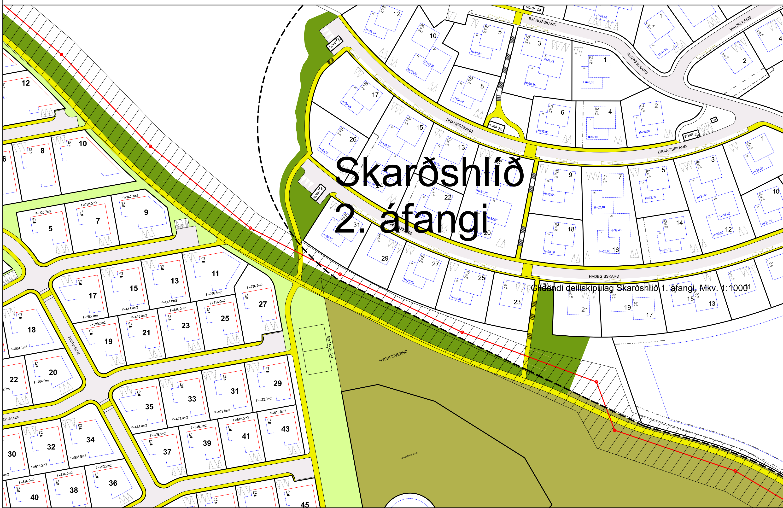
Breyting á deiliskipulagi Skarðshlíðar 2. áfanga, febrúar 2020. Mkv. 1:1000

Greinargerð Með deiliskipulagsbreytingu þessari er ætlað að koma fyrir stofnræsi frá Nóntorgi að Hraunavallaskóla.