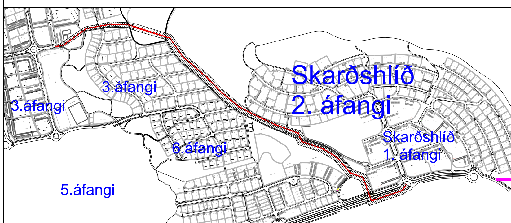
Yfirlitsmynd af Völlum. Ræsi liggur meðfram 5. áfanga. Mkv. 1:7500

Varaaflslína HS veitna sem er í jörðu við Grísanesið er einnig á sama svæði.