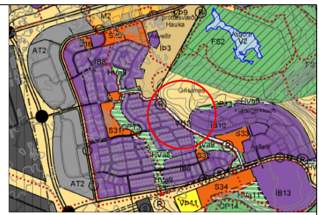
Hluti af Aðalskipulagi Hafnarfjarðar 2013 - 2025