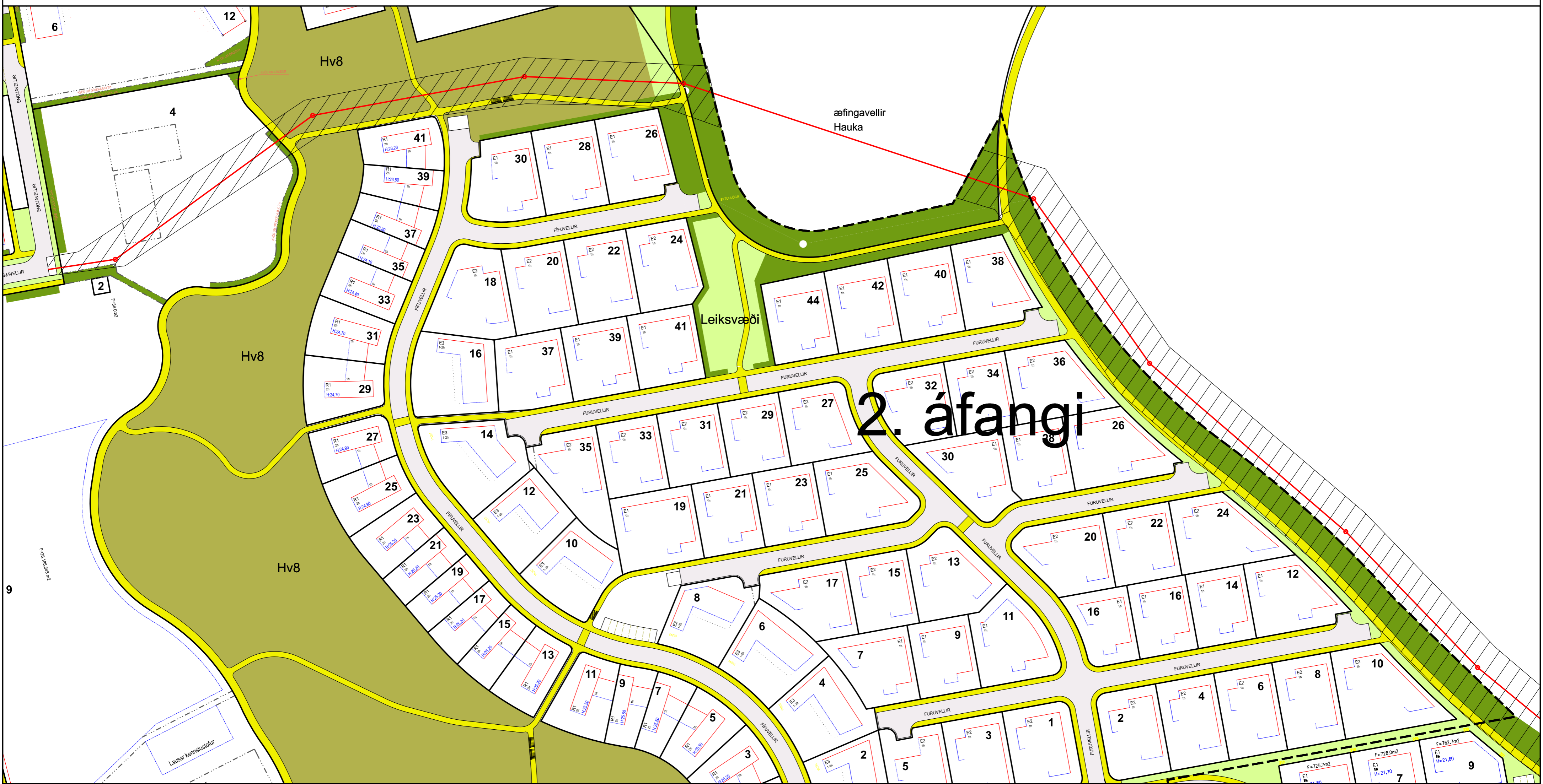
Breyting á deiliskipulagi Vellir 2. áfangi, febrúar 2020. Mkv. 1:1000