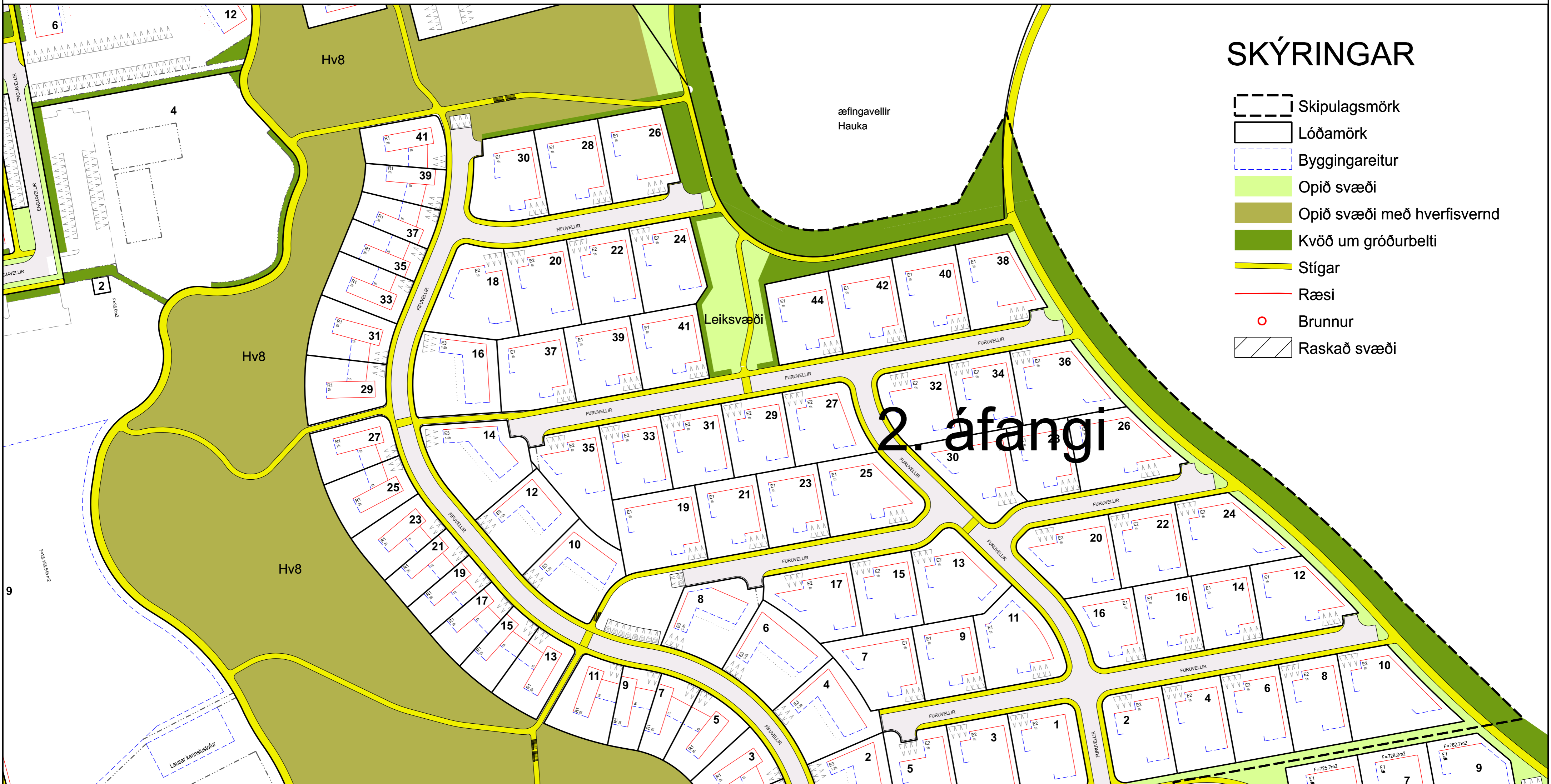
Gildandi deiliskipulag Vellir 2. áfangi. Samþykkt 10.06.2003 m. s. br. Mkv. 1:1000