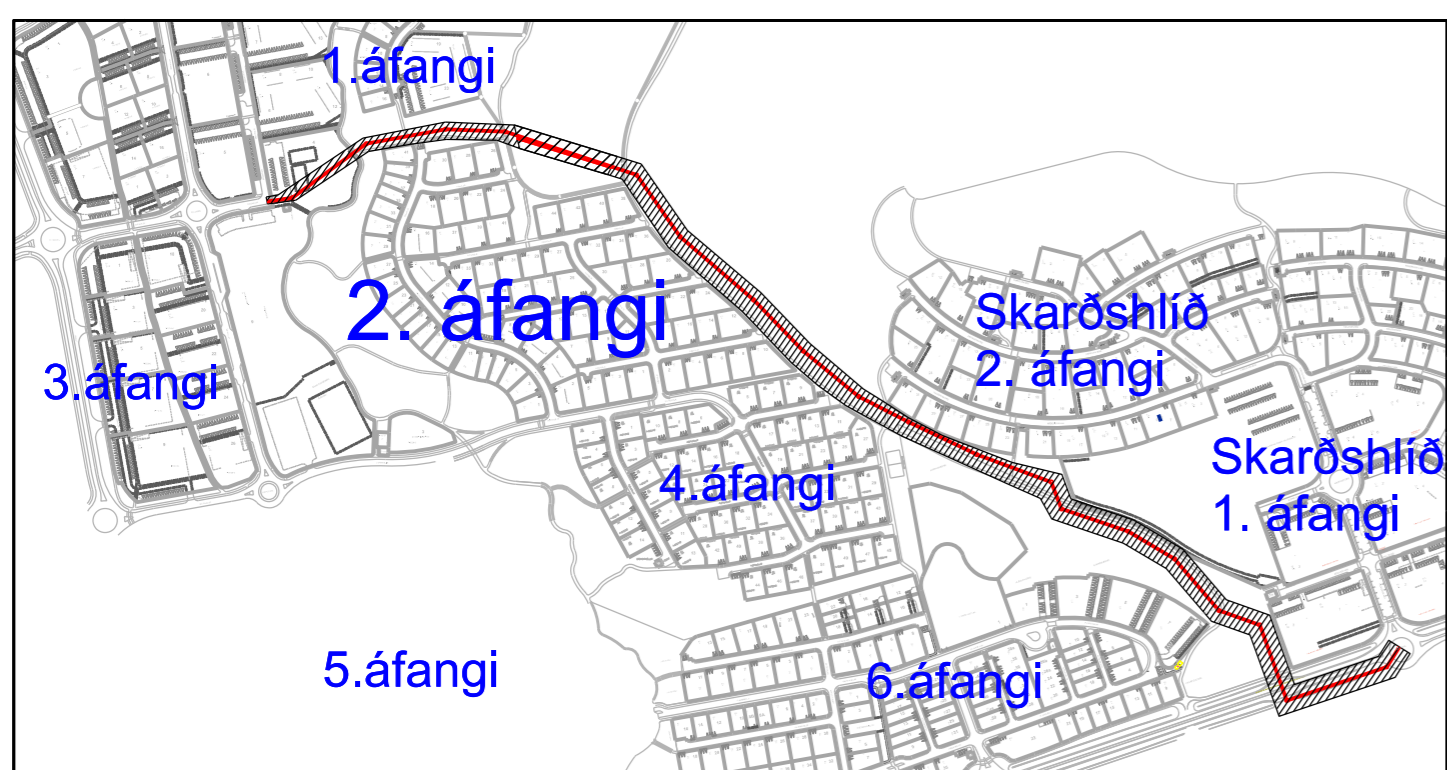
Yfirlitsmynd af Völlum. Ræsi liggur meðfram 2. áfangi. Mkv. 1:7500

Greinargerð Með deiliskipulagsbreytingu þessari er ætlað að koma fyrir stofnræsi frá Nöntorgi að Hraunavallaskóla.