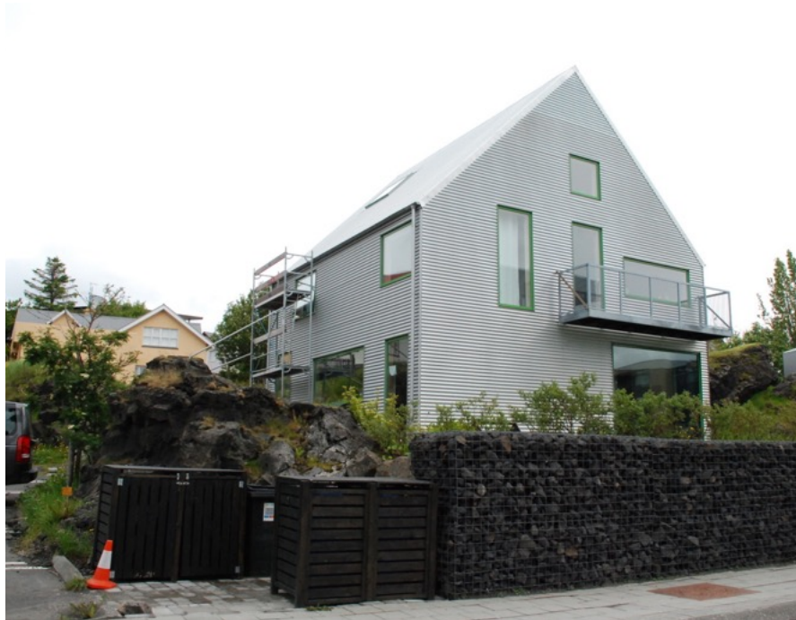
Vesturgata 12 - nýbygging