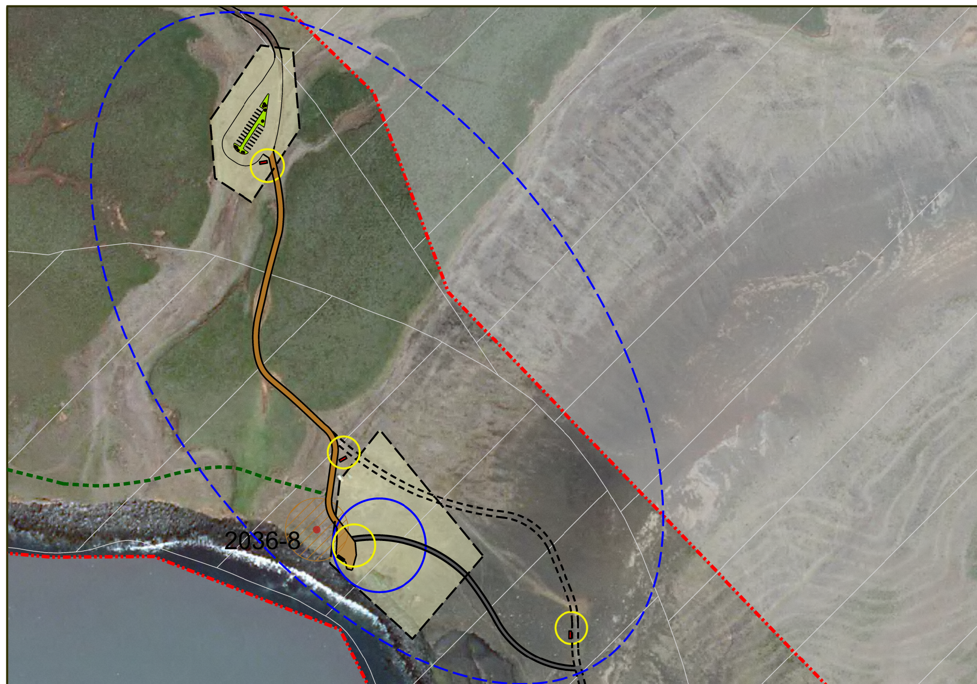
Tillaga að breytingu á deiliskipulagi í febrúar 2021 mkv. 1:2500