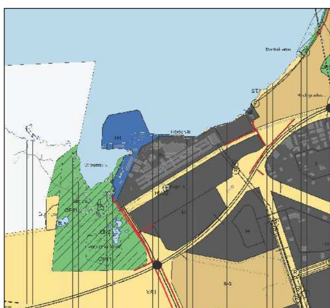
HLUTI GILDANDI AÐALSKIPLAGS 2013 - 2025