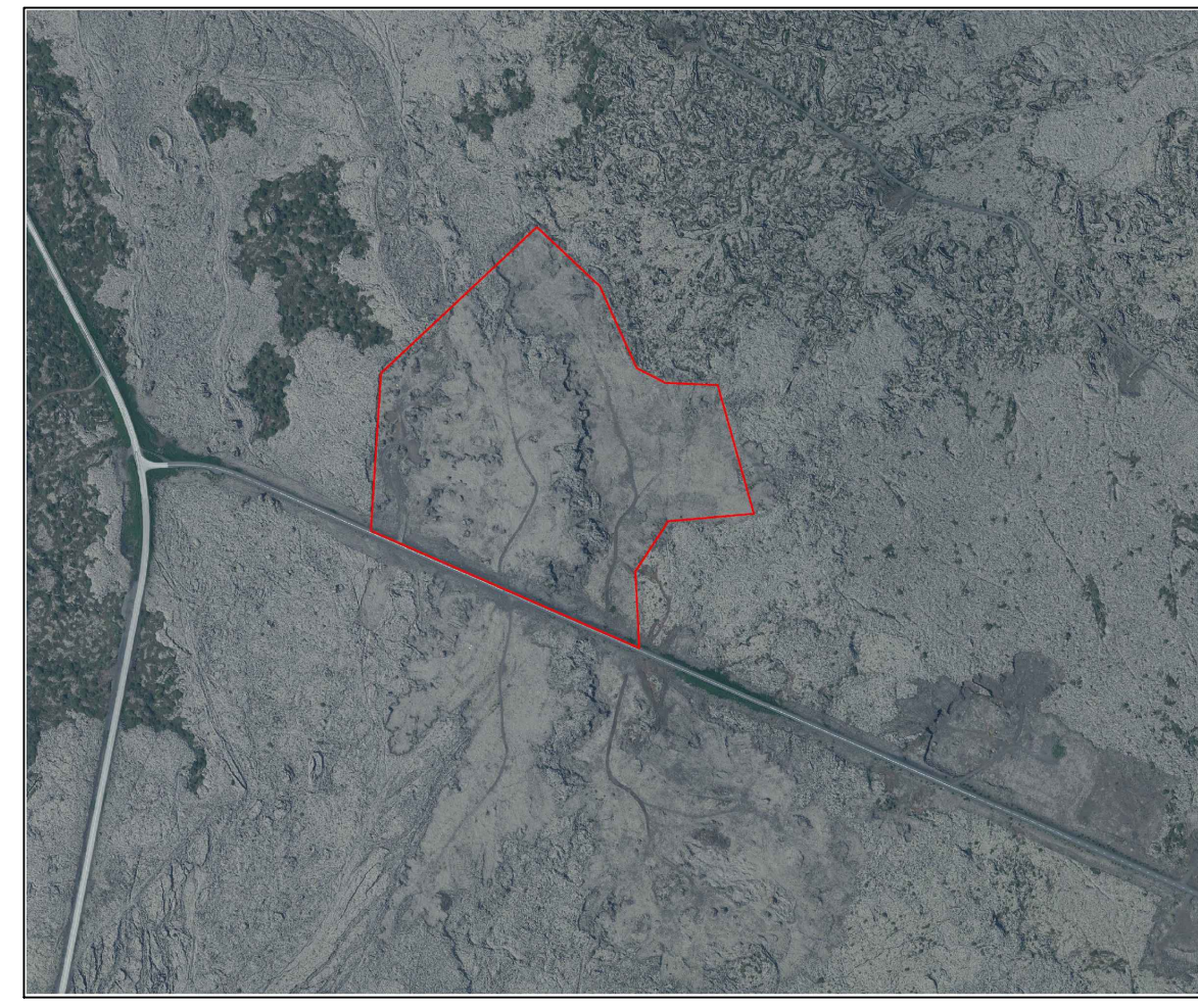
Hraunnámur við Snókalönd við Bláfjallaveg

Ekki er talið að framfylgd breytingarinnar hafi veruleg neikvæð umhverfisáhrif, en jákvæð áhrif verði vegna uppbyggingar sem þjóna mun fjölbreyttum tegundum útivistar og afþreyingar og stuðla að eflingu ferðþjónustu í Hafnarfirði.