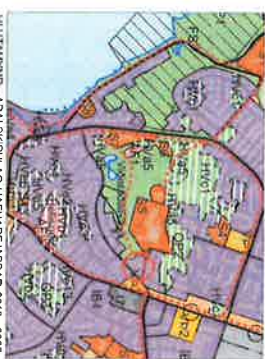
HILUFRAMM - AÐALSKIPULAG HAFNARFJARDAR 2019 - 2025