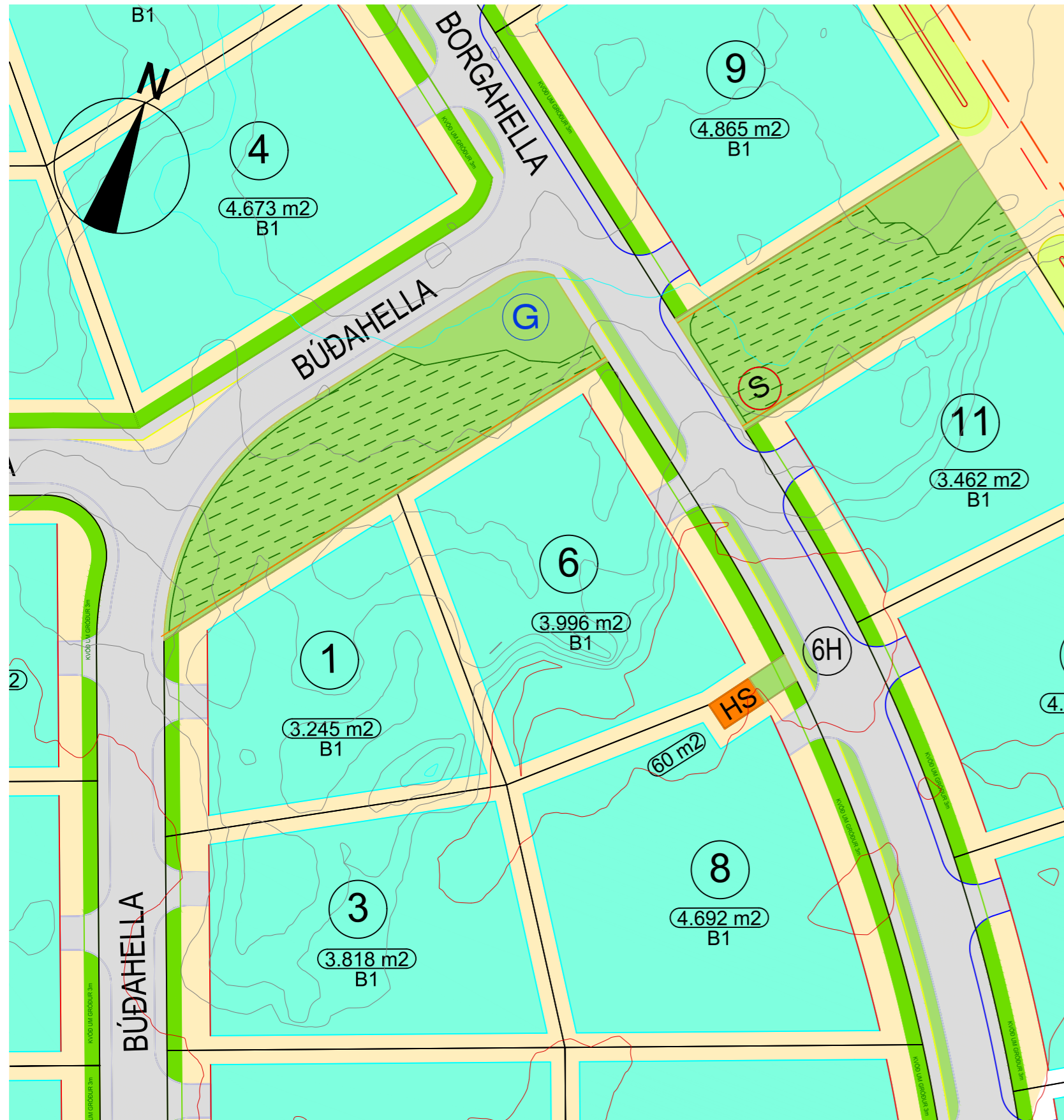
Hluti gildandi deiliskipulags Hellnahrauns 3. áfanga, samþykkt í bæjarstjórn 26. júní 2007 m.s.br MKV 1:1000