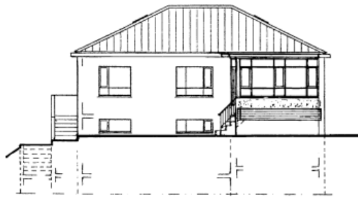
ÚTLIT MÓT SUÐ-VESTRI

Tillaga að stækkun hússins við Grænukeinn 19