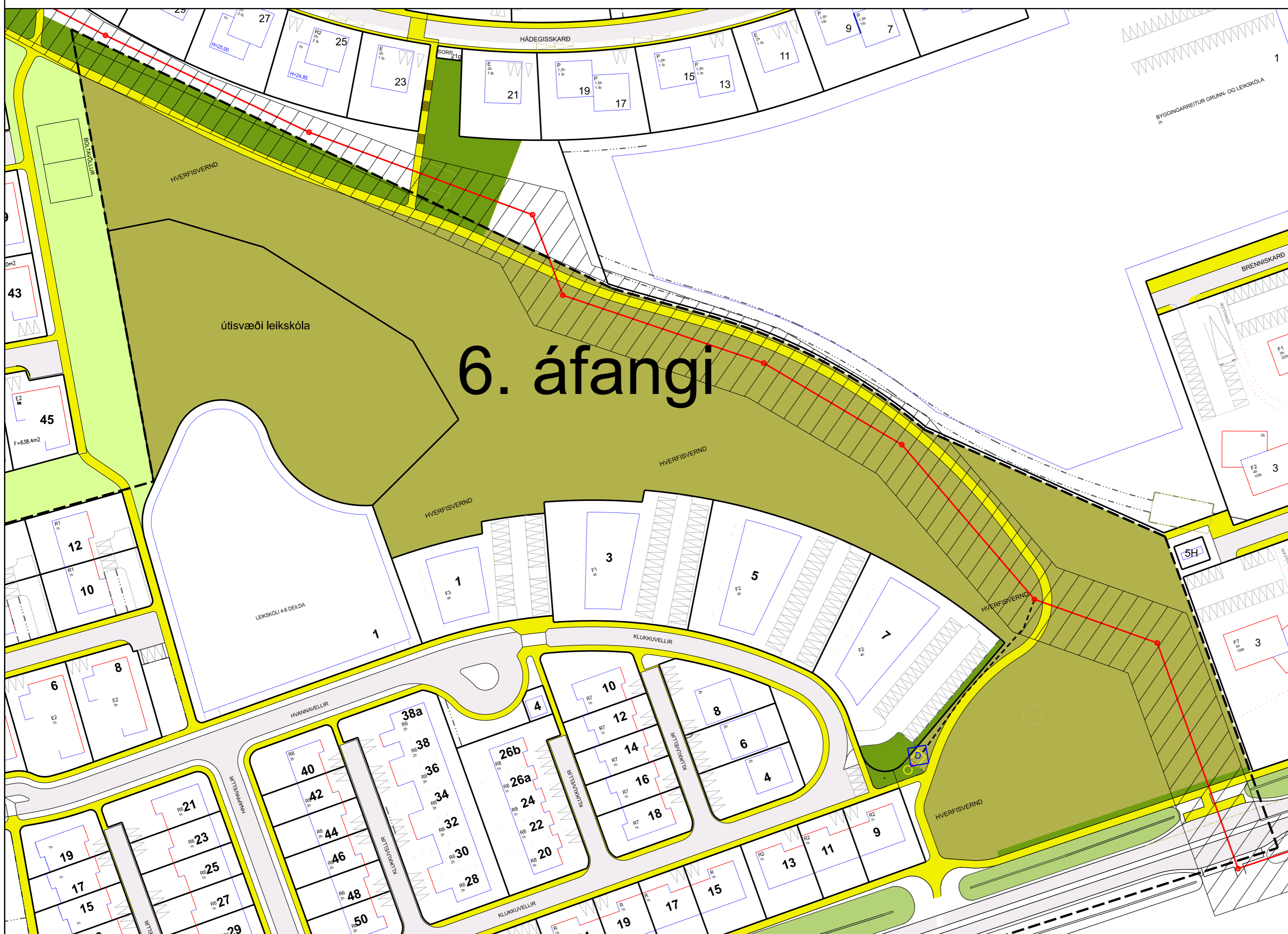
Breyting á deiliskipulagi Vellir 6. áfangi, febrúar 2020. Mkv. 1:1000

Greinargerð Með deiliskipulagsbreytingu þessari er ætlað að koma fyrir stofnræsi frá Nöntorgi að Hraunavallaskóla.