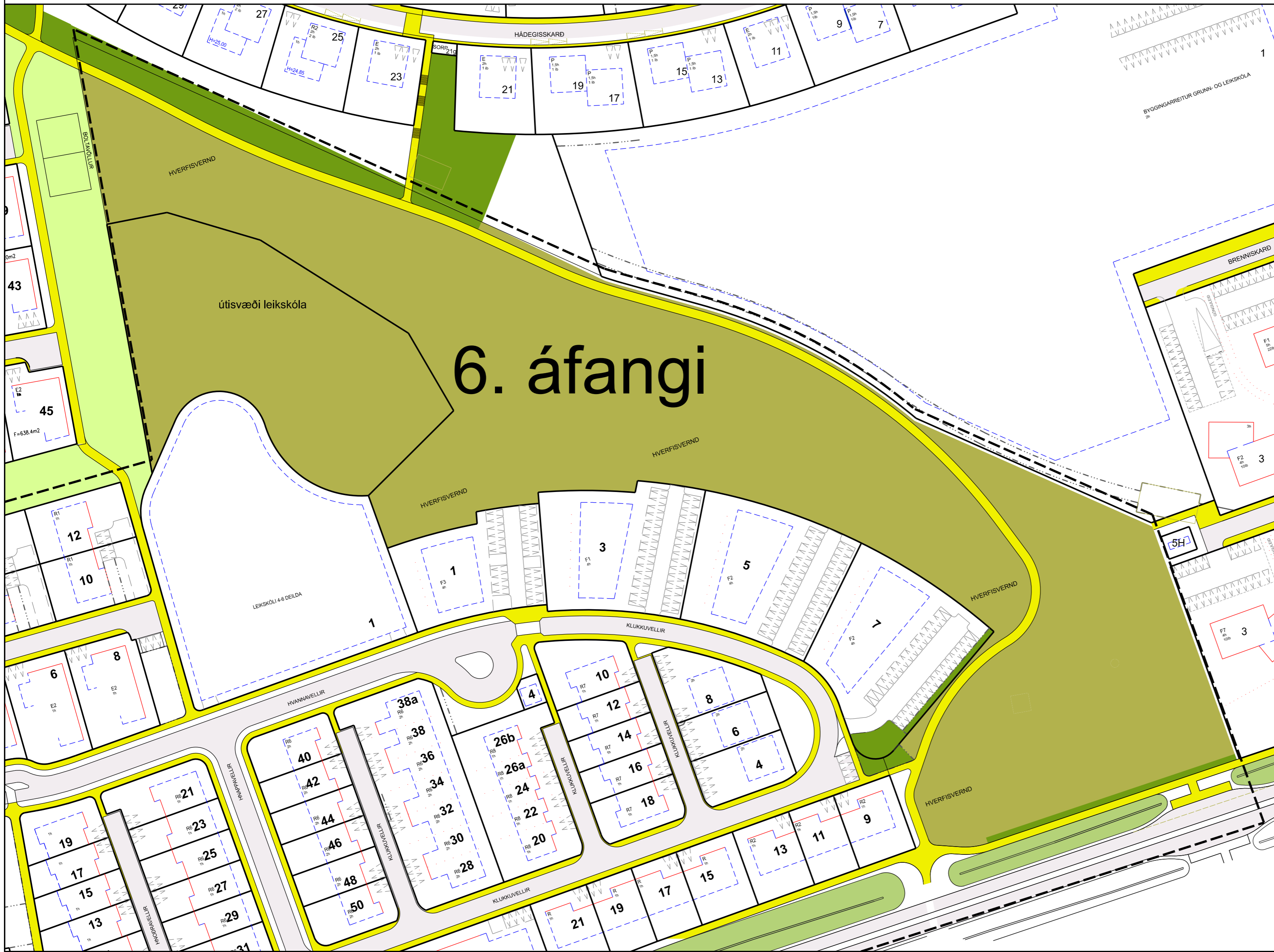
Gildandi deiliskipulag Vellir 6. áfang. Samþykkt 18. 04. 2006 m. s. br. Mkv. 1:1000