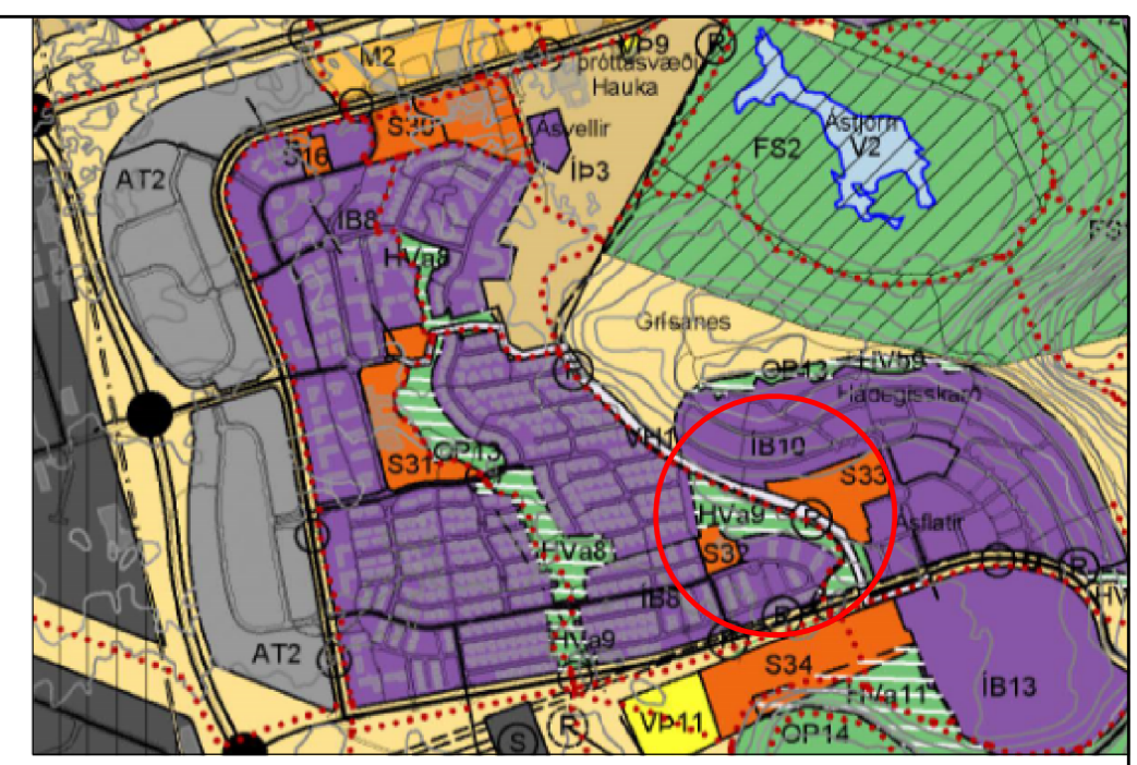
Hluti af Aðalskipulagi Hafnarfjarðar 2013 - 2025